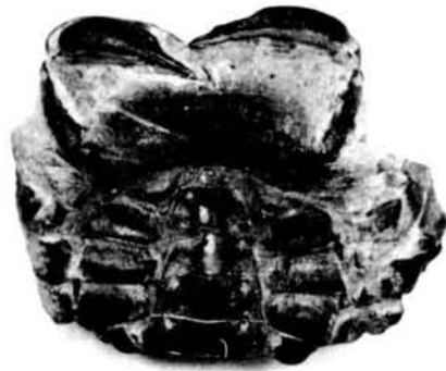
Fig. 3. Cyphoplax impressa . Visió esternal.

Fig. 2. Cyphoplax impressa , from the Conrado collection (Mallorca). Dorsal view.