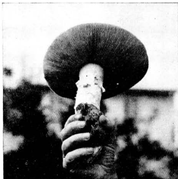
Amonita Ovoidea — Fr. ex Bull var. Próxima Dumés Pujol d'En Banya Olivares carretera de Deià

HAB: Pinar próximo al Pujol d'En Banya. Olivares carretera de Deià.