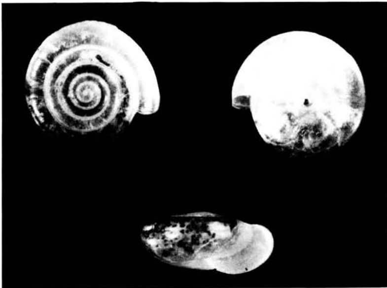
Vitrea gasulli sp. n., Holotypus.