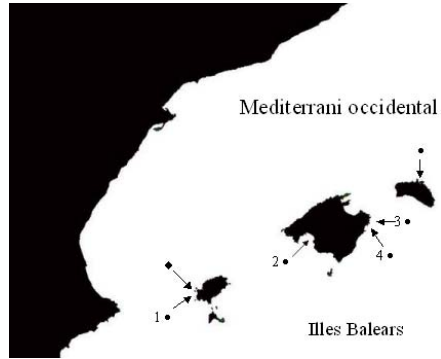
Fig. 1. Localització de les captures (●) i els albiraments (◆) de Fistularia commersonii . Els nombres identifiquen els individus de la Taula 1. Fig. 1. Capture location (●) and sighting (◆) of Fistularia commersonii . Numbers are related to the specimens in table 1.

El primer individu (exemplar núm. 1 de la Taula 1) es va capturar durant un campionat de pesca submarina a Cala d'Hort (Eivissa) el 28 d'octubre de 2007. La segona captura (exemplar 2 de la Taula