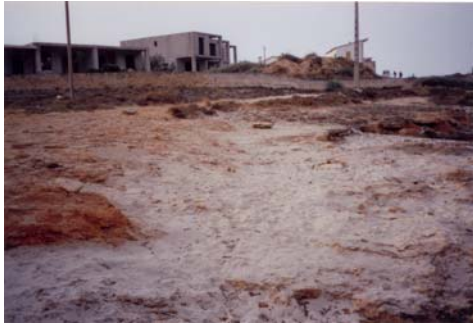
Fig 4. Jaciment de Ses Covetes (Morey et al. , 2006) milagrosament conservat baix una urbanització il·legal.

Fig 4. Ses Covetes (Morey et al., 2006) miraculously preserved deposit low illegal building.