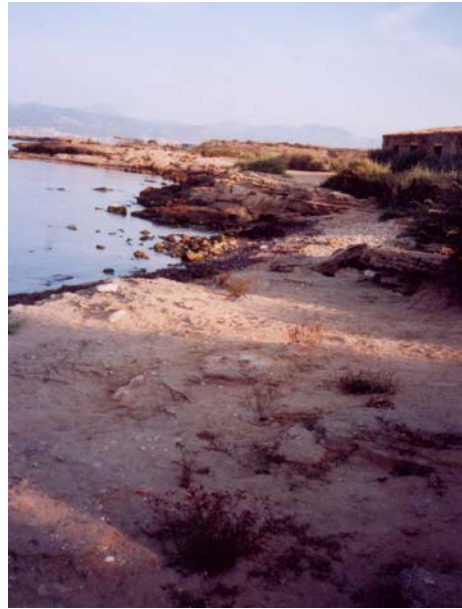
Fig 2. Jaciments de referència de Camp de Tir i Carnatge. Jaciments propers i diferents amb puntuació i estratègies de gestió semblants.

Fig 2. Camp de Tir and Carnage are main outcross valuated. These near deposits show significatives differences but present similar use and proteccion strategies.