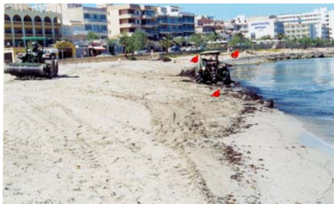
Fig 5. Destrucció del jaciment de S'Illot Bufador 2003.

Fig 5. Destruction s'Illot –bufador beach deposit (2003)