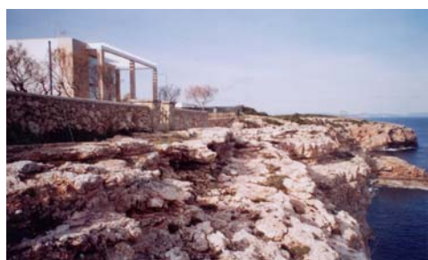
Fig 3. Jaciments de Cala Agulla (superior) i Portocolom 2 (inferior) de gran significació per la seva fauna i amb unes propostes de gestió molt distintes.

Fig 3. Cala Agulla (upper) and Portocolom II (lower) important faunistic outcross with distinct management strategies proposed.