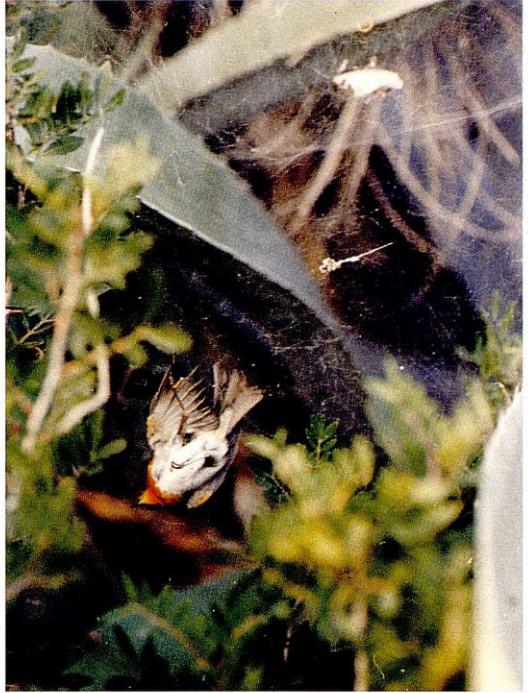
Foto 1. Ropit ( Erithacus rubecula ) atrapat en una teranyina de forma orbicular. La Mola (Formentera), novembre 1995. Robin (Erithacus rubecula) entangled in an orbicular-shaped spider's web.