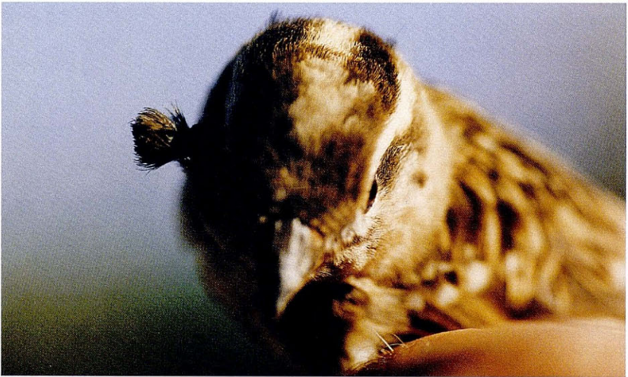
Foto 2. Gorrió foraster ( Petronia petronia ) amb una malformació de plomes a la regió auricular. La Mola (Formentera), octubre 1995.

Rock Sparrow (Petronia petronia) with a malformation of its ear-coverts.