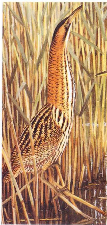
Queca Botaurus stellaris . Dibuix: François Desbordes.

part central d'Euràsia, hivernant a l'Àfrica subsahariana, al nord de l'Índia i al sud-oest de la Xina. A Europa, la situació real és complicada i poc coneguda. Segons Nick Riddiford ( com. pers. ), la població és sedentària, criant principalment al centre i al nord, amb una dispersió hivernal cap al sud (principalment a la zona mediterrània), on també hi ha petites poblacions sedentàries molt fragmentades. Aquesta dispersió la realitzen, sobretot, els exemplars menys dominants