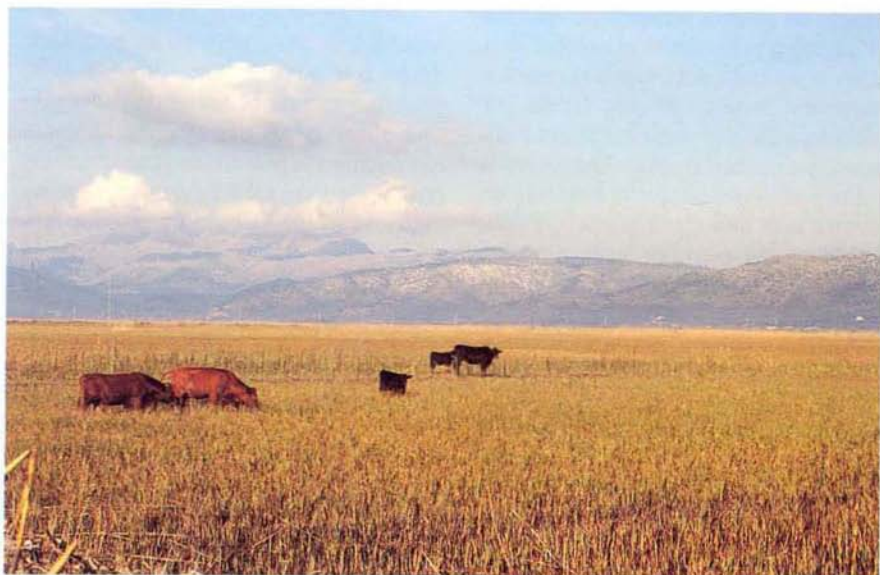
Foto 1. Pastures extensives amb bous a l'Albufera de Mallorca. Photo 1. Extensive pastures with cattle.

de l' Anuari Ornitològic del GOB, es recullen dades de la queca. A les Pitiüses sols es detecta a l'Estany Pudent de Formentera els dies 25 de maig de 1990 i el 5 de maig de 1992. A Menorca, hi ha dades d'un exemplar a Trebalúger, el 20 de maig de 1990; a Son Saura, també els 20 i 21 de maig de 1990; al barranc d'Algendar, un ex. el 22 d'agost de 1992; a Lluriac, un exemplar el 30 de març de 1996; un altre a Son Saura l'1 d'abril de 1996 i un exemplar a Boval Vella el 13 d'abril de 1996. A Mallorca, a l'Albufereta de Pollença hi ha dades d'un exemplar cantant els dies 18 d'abril i 12 de maig de 1992 i dia 6 de maig de 1993. Les dades de s'Albufera de Mallorca són molt més extenses, i comencen el 1986 amb dues dades d'audició de cant els dies 4 i 6 de març i el comentari de «és, per tant, possible que no estigui extingida com a nidificant».