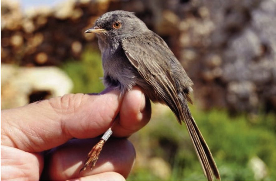
Foto 2. Mascle de segon any de busqueret sard Sylvia [sarda] sarda . 17 d'abril de 2011. Anella KY1563. Illa de l'Aire.

Photo 2. Second year male Marmora's Warbler Sylvia [sarda] sarda , 17 April 2011. Ring No. KY1563. Aire Island.