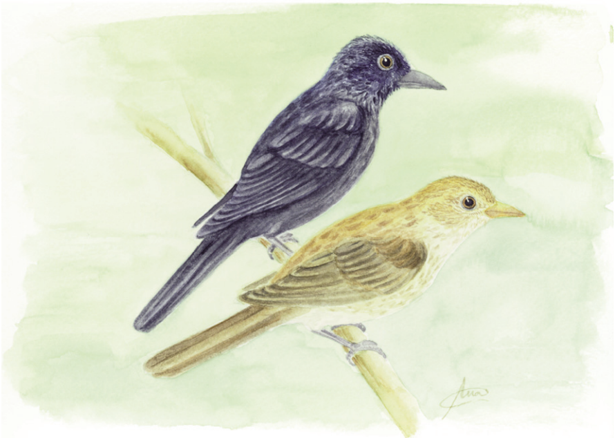
Figura 4. El pinzón de Cocos, Pinaroloxias inornata (dibujo de Ana Pérez Cembranos).

Figure 3. The warbler finch Certhidea olivacea in the illustration plate of Part III of Birds, from the Zoology of Beagle (Gould, 1841).