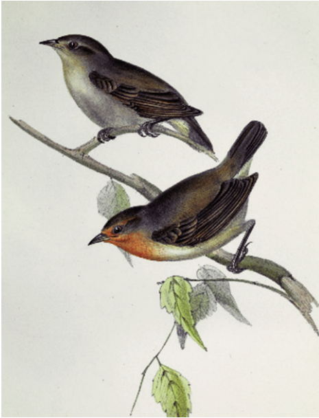
Figura 3. El pinzón curruca, Certhidea olivacea , en la lámina ilustrativa de la parte III de Aves de la Zoología del Beagle (Gould, 1841).

Figure 3. The warbler finch Certhidea olivacea in the illustration plate of Part III of Birds, from the Zoology of Beagle (Gould, 1841).