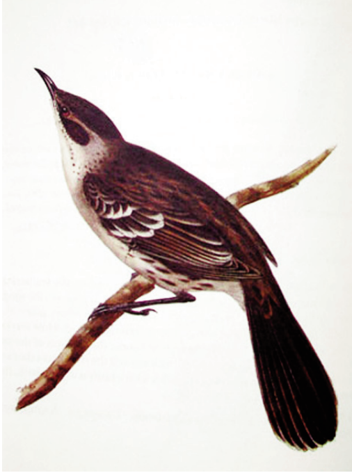
Figura 7. Sinsonte de Galápagos, Mimus parvulus Figure 7. Galapagos mockingbird Mimus parvulus

El fenómeno de especiación alopatrida, esto es, de especiación ligada al aislamiento geográfico de las poblaciones, se ejemplifica notablemente bien en el caso de los pinzones de Darwin. Los estudios de los Grant (Grant, 1987; Grant & Grant, 2008 y referencias incluidas) a lo largo de varias décadas, han demostrado que en simpatria se produce una divergencia de carácter que ayuda al aislamiento ecológico de cada una de las especies. Cuando éstas se hallan en alopatría, las morfologías de sus picos y el tamaño y características del alimento consumido son casi coincidentes. Este es el fenómeno denominado de Divergencia de Carácter en Biología Evolutiva. Los Grant han demostrado que tanto la