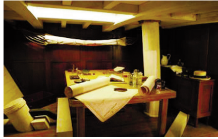
Figura 1. Reconstrucción de la cabina de popa del Beagle , donde Darwin vivió y trabajó durante el largo viaje alrededor del mundo.

El viaje del Beagle es, en buena parte, un viaje de isla en isla. Sin menoscabo de la importancia que tienen sus