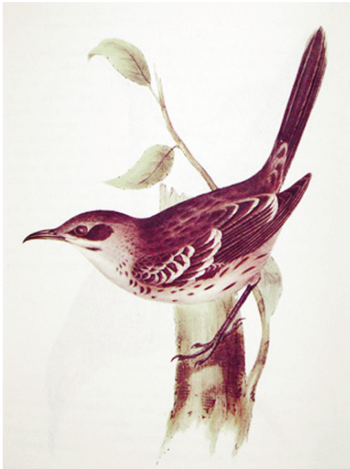
Figura 5. Sinsonte de San Cristóbal, Mimus melanotis , ilustrado en la Zoología del Beagle (Darwin, 1841). Figure 5. San Cristóbal mockingbird Mimus melanotis as illustrated in the Zoology of the Beagle (Darwin, 1841).

debieron adaptar. En una primera radiación adaptativa, aparecerían formas adaptadas a este clima tropical húmedo o quizás una sola especie (Grant & Grant, 2008). Después, la vegetación de las islas cambia, para transformarse en un bosque seco de hoja caduca en las tierras bajas y un bosque tropical verde en las zonas más altas. De acuerdo con tales cambios, los pinzones se diversifican y aparece, por un lado, el pinzón de Cocos, P. inornata , aislado en dicho enclave y, por otro, la rama evolutiva de los pinzones currucas, representados actualmente por el género Certhidea .