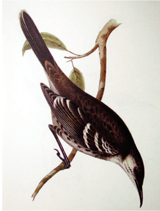
Figura 6. Sinsonte de Floreana, Mimus trifasciatus Figure 6. Floreana mockingbird Mimus trifasciatus

Lo más interesante es que las características craneales relacionadas con la forma del pico de cada especie parecen haber modulado también las características de vocalización de las mismas, de modo que los cantos y reclamos actuarían como barreras imperfectas de aislamiento reproductivo. De este modo, la hibridación aparecería bajo determinadas circunstancias ambientales, permitiendo en cierta medida la introgresión genética entre especies próximas, lo que determinaría un mantenimiento o aumento de la variabilidad genética de las especies y la mayor facilidad para evolucionar hacia direcciones novedosas en caso de cambios en las condiciones ambientales. La hibridación, desde ese punto de vista, sería un motor del propio cambio evolutivo, añadiendo potenciali-