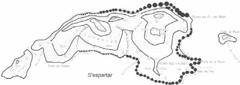
Densidad relativa de Hydrobates pelagicus melitensis