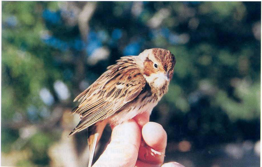
Foto 3. Hortolà petit. Emberiza pusilla (Little Bunting). La Mola (Formentera), exemplar de primer hivern, octubre 1998.