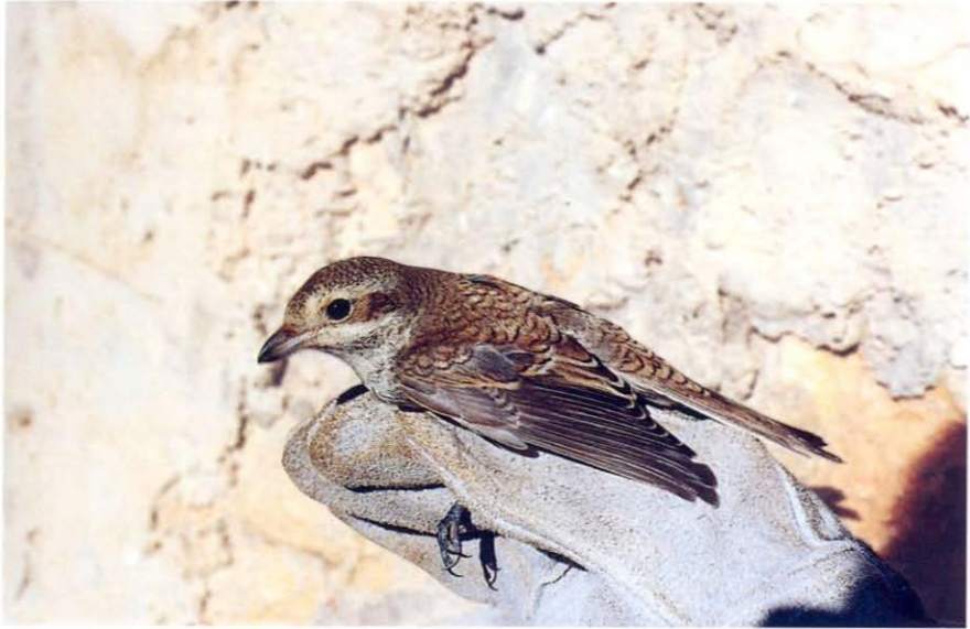
Foto 1. Capsigrany d'esquena roja Lanius collurio (Red-backed Shrike). Cabrera, jove de l'any, octubre 2000.

ocupa pràcticament tota Europa menys les illes Balears, Sardenya, Creta i Xipre.