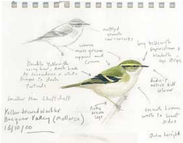
Dibuix 1. Ull de bou de dues retxes Phylloscopus inornatus (Yellow-browed Warbler). Vall de Bóquer (Pollença, Mallorca), octubre 2000. Dibuix: John Wright.