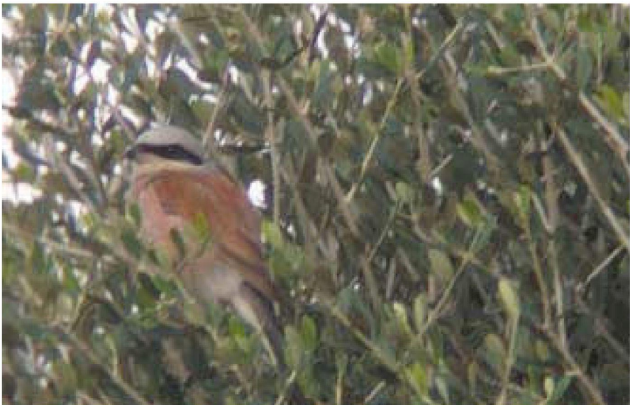
Foto 4. Capsigrany d'esquena roja Lanius collurio (Red-backed Shrike). Cap de ses Salines (Santanyi, Mallorca), mascle adult, octubre 2002.