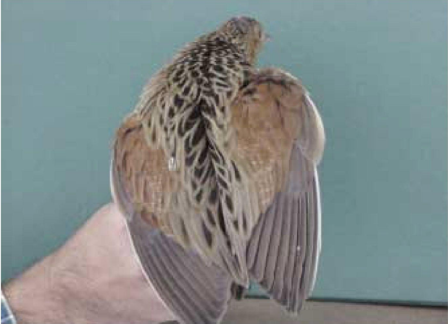
Foto 1. Guàtlera maresa Crex crex (Corncrake). Son Mora (Porreres, Mallorca), octubre 2002.