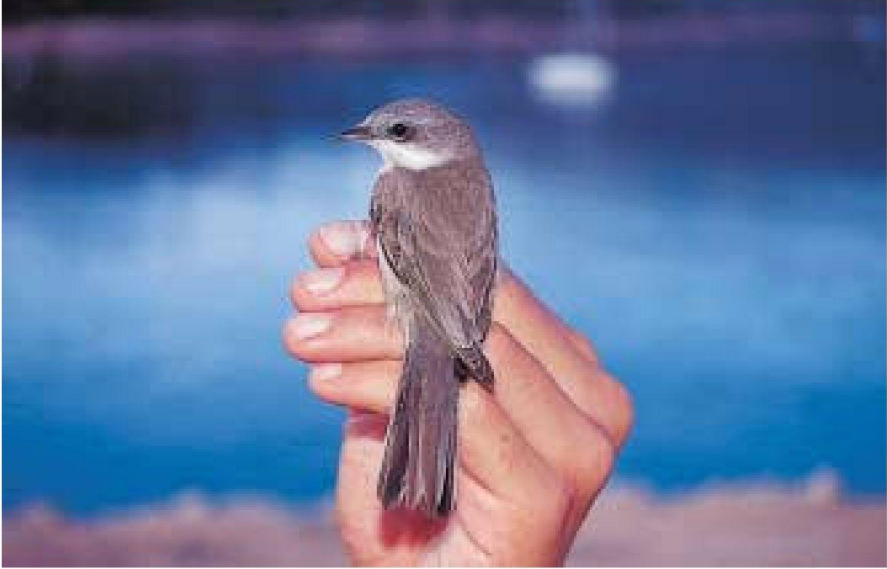
Foto 3. Busqueret xerraire Sylvia curruca (Lesser Whitethroat). Cabrera, juvenil, setembre 2001.