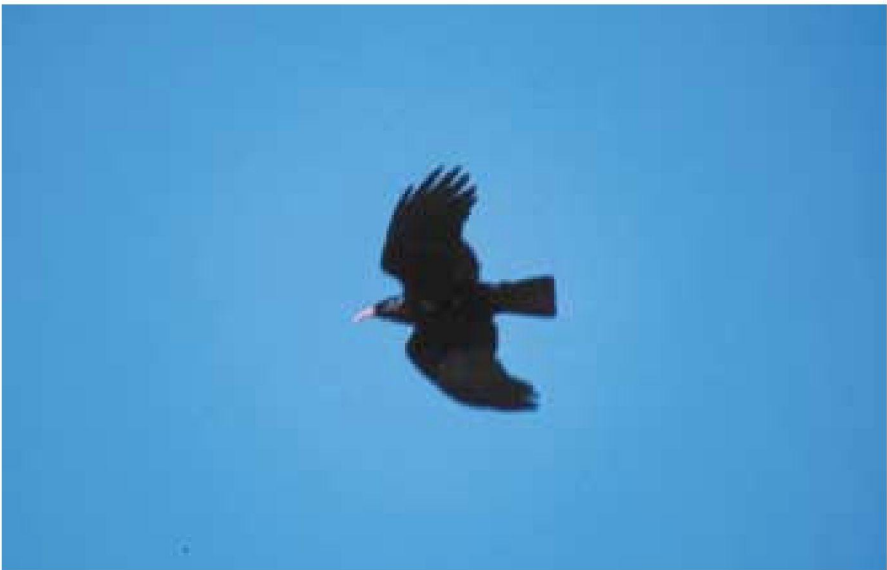
Foto 6. Gralla de bec vermell Pyrrhocorax pyrrhocorax (Chough). Puig de Massanella (Escorca, Mallorca), març 2002.