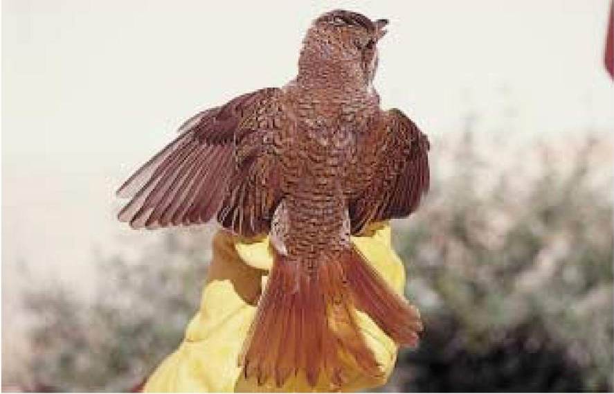
Foto 5. Capsigrany d'esquena roja Lanius collurio (Red-backed Shrike). Cabrera, jove, setembre 2001.