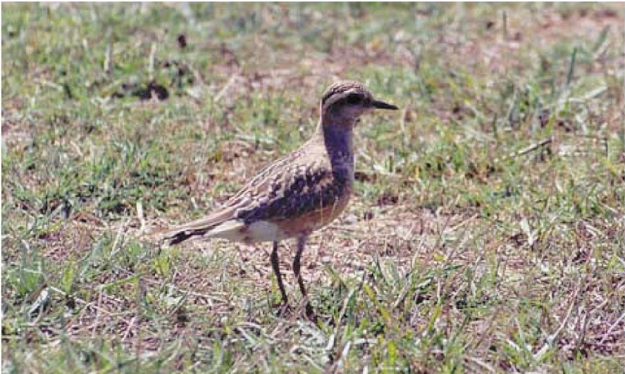
Foto 2. Fuell de collar Charadrius morinellus (Dotterel). Aeroport des Codolar (Sant Josep, Eivissa), setembre 2002.