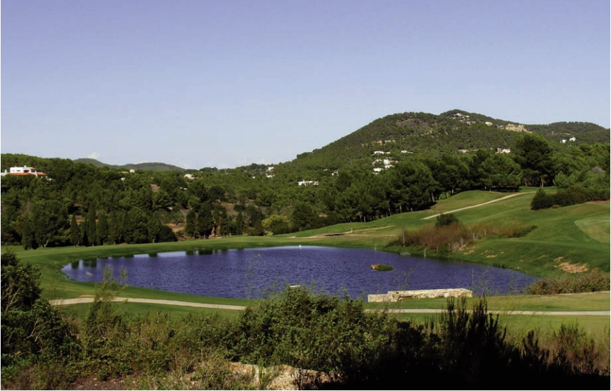
Foto 1. Bassa del golf de Roca Llisa (Santa Eulària des Riu, Eivissa), on el setmesó Tachybaptus ruficollis , ha criat el 2007. Photo 1. Roca Llisa golf course pond (Santa Eulària des Riu, Eivissa), where the little grebe Tachybaptus ruficollis bred in 2007.