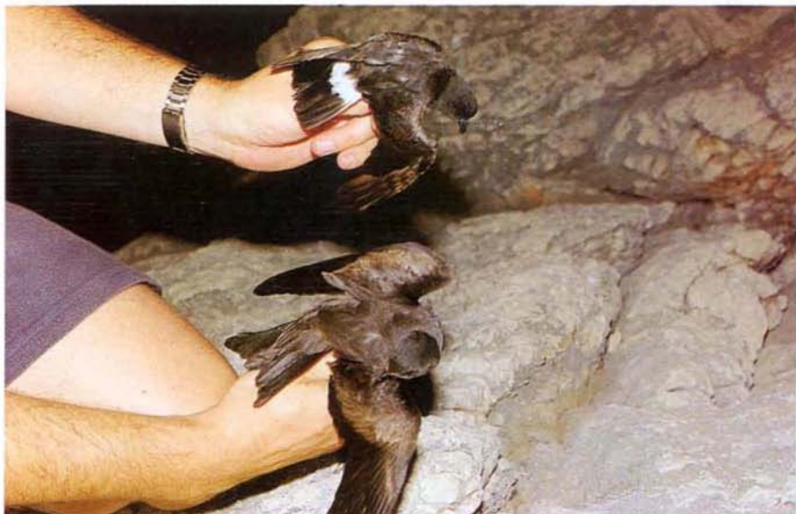
Foto 1. Abajo paíño de Swinhoe O. monorhis ; arriba paíño europeo H. pelagicus . A baix petrell de Swinhoe O. monorhis; a dalt noneta H. pelagicus. Swinhoe's Storm-petrel (below) European Storm-petrel (above).