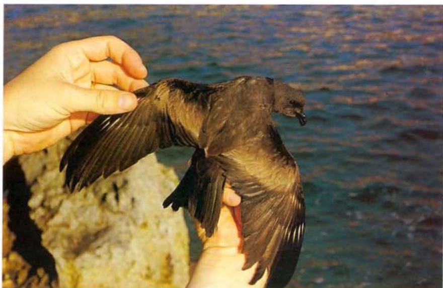
Foto 2. Aspecte dorsal paíño de Swinhoe O. monorhis capturat en Ses Bledes. Aspecte dorsal del petrell de Swinhoe O. monorhis capturat a ses Bledeses. Dorsal view of Swinhoe's Storm-petrel captured on Ses Bledes.