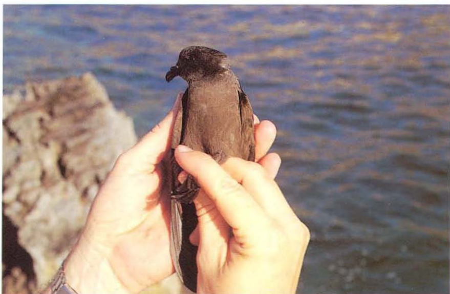
Foto 4. Detalle de la cabeza del paíño de Swinhoe O. monorhis capturado en Ses Bledes. Detall del cap del petrell de Swinhoe O. monorhis capturat a ses Bledes. Head detail of Swinhoe's Storm-petrel captured on Ses Bledes.