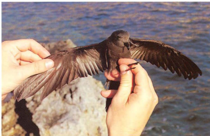
Foto 3. Aspecto ventral del paíño de Swinhoe O. monorhis capturado en Ses Bledes. Aspecte ventral del petrell de Swinhoe O. monorhis capturat a ses bledes. Ventral view of Swinhoe's Storm-petrel captured on Ses Bledes.