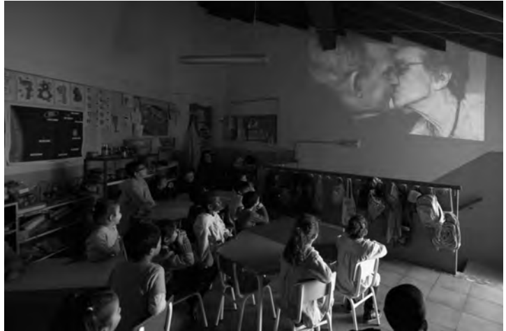
Imatge 4 | Sessió formativa a l'aula

El projecte es duu a terme amb una metodologia participativa, activa, tant per als professors i tècnics com per a l'alumnat que el desenvolupa. Els objectius didàctics no solament «s'aprenen», sinó que també volem que «s'exerceixin», que els nins reconeixin el valor del gest i els beneficis de la comunicació no verbal, que reconeixin l'emoció com a eina valuosa per a la comprensió i l'entesa. Aquest projecte de la Conselleria de Família i Serveis Socials s'ha posat en marxa amb la col·laboració de l'Obra Social La Caixa, la Conselleria d'Educació, Cultura i Universitats, i el Col·legi Oficial d'Infermeria de les Illes Balears.