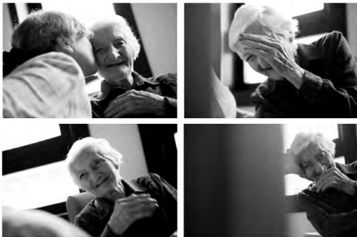
Imatge 3 | Fotografies del projecte "El gesto como terapia. Fotografías Antonio Molina"

Segons publicà el CREA de Salamanca el 2012: «[...] La funció dels afectes en les demències evidencia la importància que la seva atenció graviti en la persona afectada. Segons Bowlby, la vinculació afectiva és instintiva i les persones amb Alzheimer mantenen la vinculació afectiva fins al final. [...] Si connectam amb les emocions de la persona malalta, establim la comunicació. Perden pes les paraules i guanyen protagonisme els missatges no verbals. Des del punt de vista biològic, està constatat que l'amígdala i, en conseqüència, les persones amb Alzheimer, són molt sensibles als successos emocionals. Aquesta perspectiva ens ofereix un camí poc transitat: la relació de les emocions i l'Alzheimer. Ens queda molt per aprendre, educar i formar per millorar l'atenció a les demències».