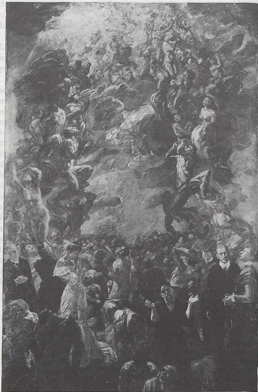
Max Beckmann - Auferstehung (1908 vollendet) 1909 datiert und ausgestellt