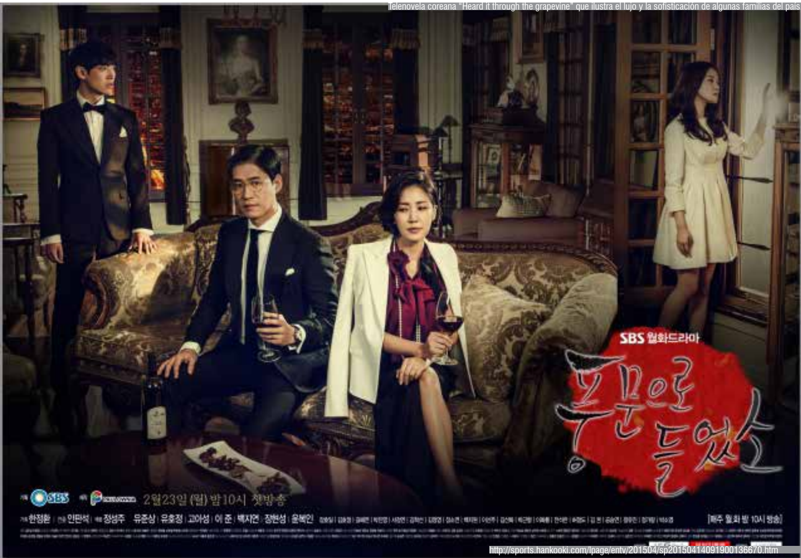
La telenovela coreana "Heard it through the grapevine" que ilustra el lujo y la sofisticación de algunas familias del país.

se traduzca necesariamente en comunicación social inter-cultural. Para que la comunicación entre las culturas se forje de manera positiva y productiva las interacciones e intercambios deben cumplir ciertas premisas básicas: i.) una visión horizontal y dinámica de las culturas; ii.) una concepción discursiva de la realidad y las relaciones sociales; iii.) una ciudadanía que reconozca la igualdad de derechos y el respeto por la otredad. Es más oportuno señalar que la presencia cultural de las telenovelas coreanas en Latinoamérica ha creado nuevos conocimientos mutuos y un espacio de reflexión sobre la otredad cultural y, en consecuencia, sobre el sí mismo. De ahora en adelante, las políticas culturales -tanto en Corea como en los distintos países de América Latina- tendrán que asumir el desafío de diseñar e instrumentar estrategias culturales, simbólicas y comunicacionales eficaces para generar acercamientos entre universos de sentido tan distintos y distantes, y construir diálogos interculturales que contribuyan de un modo legítimo a la integración social de la diversidad.