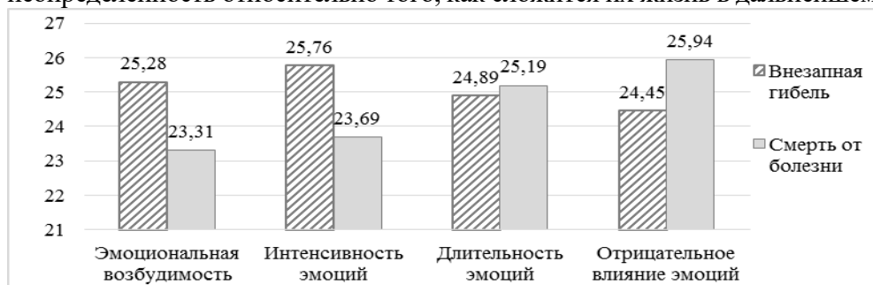
Рис. 2. Различия показателей эмоционального реагирования в подгруппах.

резким и неожиданным переменам в их жизни. Они отмечают чувство растерянности, крушение планов, связанных с ушедшим, и неопределённость относительно того, как сложится их жизнь в дальнейшем.