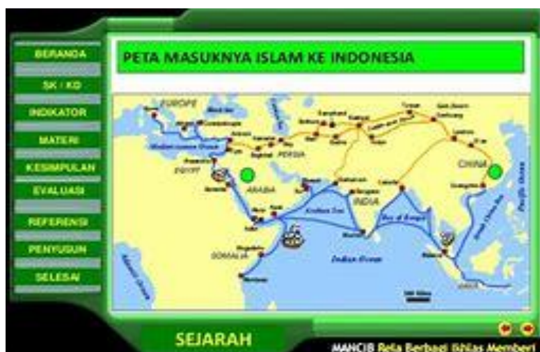
Gambar 3. Jalur Kedatangan Islam ke Indonesia

Berkaitan dengan penentuan waktu masuknya Islam ke Indonesia menurut Hasan berkaitan dengan bagaimana kita memaknainya. Teori yang menyatakan Islam masuk pada abad ke-1 Hijriah atau abad ke-7 Masehi dapat diterima apabila dimaknai masuknya Islam adalah sampainya individu-individu pemeluk Islam dari Arabia, Persia atau India ke Indonesia. Sebaliknya jika dipahami masuknya Islam ke Indonesia adalah terdapatnya orang pribumi dalam komunitas yang besar, maka teori yang menyebutkan Islam masuk ke Indonesia abad ke-13 lebih dapat diterima. Dalam menyikapi diskusi tentang ini Uka Tjandrasmita menyarankan pembedaan antara tahapan; 1) kedatangan Islam di