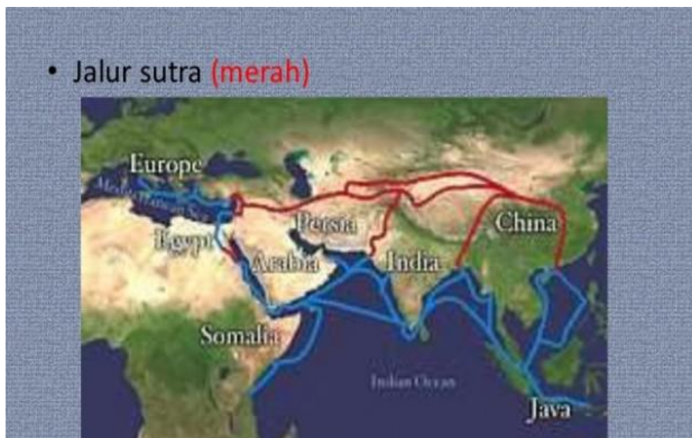
Gambar 1. Jalur Dagang Bangsa Arab

Garis merah pada peta diatas menggambarkan jalur darat perdagangan bangsa Arab pada musim dingin, sedangkan garis biru menggambarkan jalur laut yang ditempuh pada musim panas. Jalur ini ditempuh karena salju membuat caravan para pedagang tidak dapat bergerak/berjalan. Penjelasan ini sejalan dengan tafsir para mufassir terhadap QS. al-Quraish:1-4. Para ahli tafsir baik klasik, seperti al-Thabari, Ibn Katsir, Zamakhsyari, maupun kontemporer seperti, al-Maraghi, az-Zuhaily, dan Sayyid Qutb, sepakat bahwa perjalanan dagang musim dingin dilakukan ke utara seperti Syria, Turki, Bulgaria, Yunani, dan sebagian Eropa Timur. Sementara perjalanan musim panas dilakukan ke selatan seputar Yaman, Oman, atau bekerja sama dengan para pedagang Cina dan India yang singgah di pelabuhan internasional Aden.