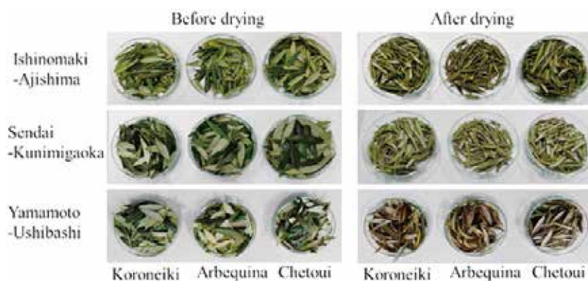
Fig. 2. 各種オリーブ葉の試料調製（乾燥前と乾燥後）の様子

採取した各オリーブの葉100～200枚程度を蒸留水で洗浄後、乾燥機（Food Dehydrator LT-81）で80℃、2時間乾燥し（Fig. 2）、粉碎機（Multi Grinder, BioloMix700）で粉末にした。乾燥の目的は3つあり、葉中のポリフェノール酸化酵素や加水分解酵素を失活させる事、水分を除去して葉中の代謝活性を極力無くす事、保存性を高める事である。予備実験において80℃、2時間の処理条件が、乾燥葉を最短時間で安定的に得られることがわかった。尚、乾燥前の重量に対する乾燥後の重量から、水分含量を算出した（Table 2）。3品種の水分含量は47.8～53.3%の範囲にある事、特に Chetoui は全ての栽培地において他の2品種と比べて水分含量が多い傾向を示した。各種オリーブ葉の乾燥粉末1.0gを遠沈管に入れ、70%エタノール10mLを加え、室温（24℃±2℃）、暗所下で3日間振とうした。その後、遠心力5,500×g、10分間遠心分離し、上清を回収、10mLに定容し、ポリフェノール抽出液とした。各種分析実験を実施するまで4℃下で遮光保存した。