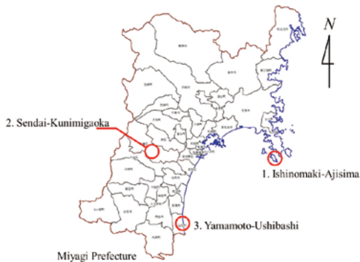
Fig. 1. 宮城県内のチュニジア産オリーブの試験栽培地

味深い報告をしている 8) 。我々は、チュニジアの種苗会社とチュニジア農業省の協力を得て、貴重な Chetoui 種を試験研究用として寄贈を受け、寒冷地の東北宮城での栽培を開始した。今年（2020年度）で2年目を迎え、2度目の越冬に挑戦している。苗木の背丈は移植時には約30cm 程度であったが現在では100～150cm までに成長している。元々オリーブの葉は冬季の剪定時に大量に廃棄されていた未利用資源であったが、上述したような生理活性を有することから、葉茶を始めとする食品素材、保健機能素材、飼料として再び注目され、商品開発の研究も進んでいる 9)10) 。本研究ではチュニジア産 Chetoui と、同時に栽培した Arbequina、Koroneiki の3品種を用いて、オリーブ葉抽出物中のポリフェノール含量と抗菌活性について調べたので報告する。将来的には寒冷地宮城で栽培したチュニジア産オリーブ等から、健康機能に寄与する成分を明らかにし、付加価値向上と地域振興に寄与することを目指す。