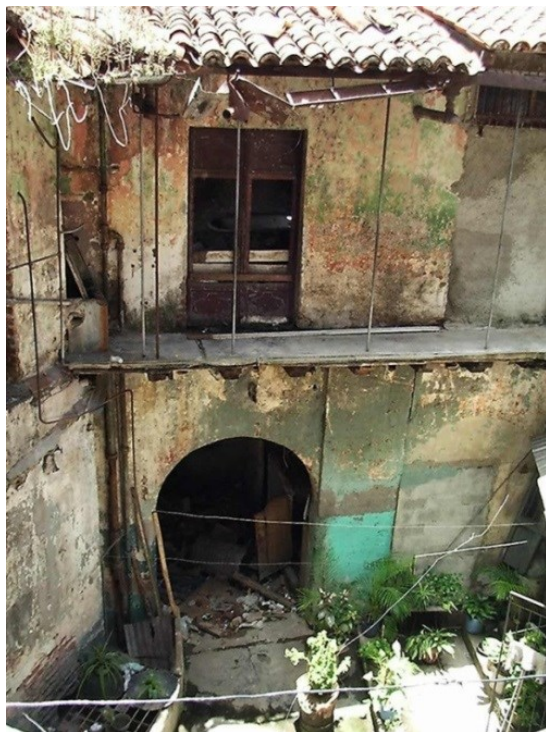
Fig. 2 Patio Interior antes de la Rehabilitación