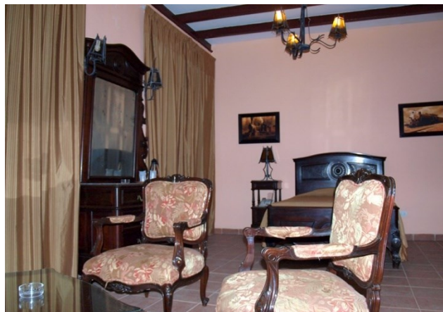
Fig. 6 Muebles que hacen alusión a la época colonial