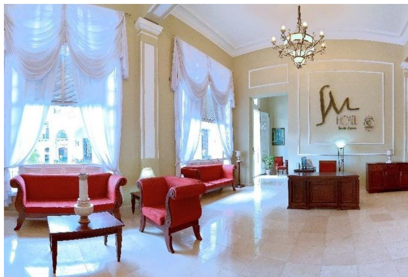
Fig. 8 Hotel Santa María vestíbulo – recepción

En el tratamiento del espacio interior y la decoración es significativo resaltar la espacialidad lograda en las áreas públicas y habitaciones, la que le otorgan