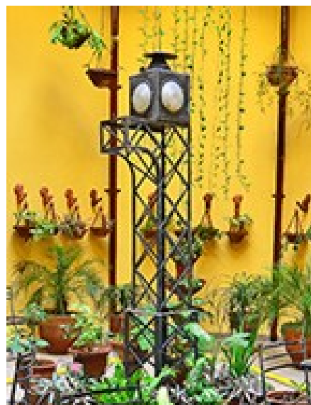
Fig. 5 Detalle de barra y elemento de ferrocarril en el patio