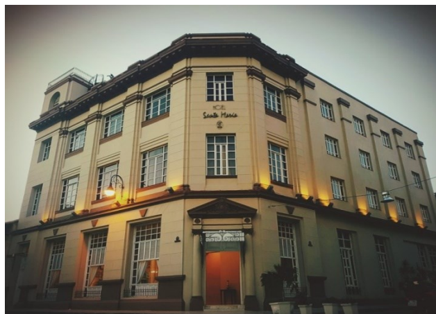
Fig. 7 Hotel Santa María. Fachadas principales

Para el tratamiento de la imagen exterior del edificio se realizó un proyecto de integración muy bien logrado, que emplea la misma línea de fachada y los recursos formales simplificados que el eclecticismo, y su interpretación neoclásica, aportaron al inmueble principal (Fig. 7). Con una visión contemporánea se estilizan y distribuyen pilastras a lo largo de la nueva fachada y se genera un sistema de vanos que dialogan en disposición y proporción con los elementos originales del edificio principal.