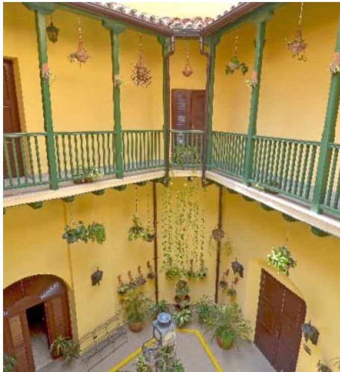
Fig. 3 Patio interior después de la intervención

El proyecto construido, consideró el desarrollo de un hostel con nueve habitaciones, siete en planta alta y dos en primer nivel, articuladas mediante un vestíbulo-recepción ubicado en el antiguo zaguán de la vivienda y hacia la plazuela del Gallo; así como un servicio de bar-restaurante, que garantiza animación las 24 horas y genera un mejor diálogo del edificio con su entorno (Fig. 4).