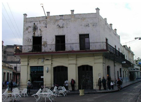
Fig. 1 Edificio Camino de Hierro antes de la Rehabilitación

El edificio se encontraba muy deteriorado en el momento de iniciarse los trabajos de levantamiento y defectación en 2006 (Fig. 1). Las causas fundamentales del deterioro estaban asociadas al mal uso del inmueble, que por décadas había servido como vivienda a varios núcleos familiares, y a sucesivas intervenciones ilegales que generaron transformaciones y pérdidas de espacios y de elementos estructurales y de cierre al inmueble. En el momento de la intervención, acciones vandálicas desarrolladas por los moradores del inmueble, habían sustraído todos los elementos de madera elaborada de los entresijos, cubiertas y dinteles en ambos niveles, creando una situación de inestabilidad y riesgo (Figs. 2 y 3) que generó un proyecto complejo de apuntalamiento y demolición, para lograr consolidar los elementos de valor que aún se conservaba.