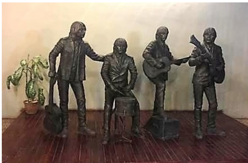
Fig. 12 Conjunto escultórico interior. Los Beatles

Otro grupo de obras fueron desarrolladas como parte del programa ciudad 500, vinculadas con el turismo en esa zona. Se rehabilita una antigua casona colonial propiedad del Centro Provincial del Cine, para bar con la temática de la vida y la obra de los Beatles y allí fueron representados en un conjunto escultórico con el cual interactúan los visitantes y usuarios (Fig. 12). Un antiguo inmueble almacén se recuperó y se