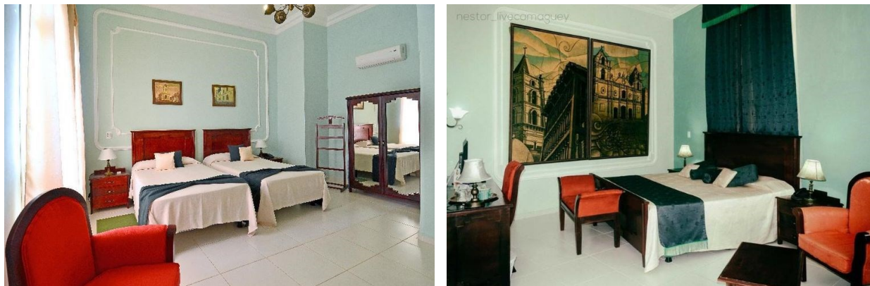
Fig. 9 Hotel Santa María. Habitaciones

atinado el incorporar al grupo creativo DECO Mcpherson, adscrito al FCBC, cuya ejecución dotó al inmueble de piezas de alta calidad, afines a los diseños y conceptos demandados, ejecutados con un alto nivel y con la garantía de exclusividad y personalización para cada espacio y función (Fig. 9).