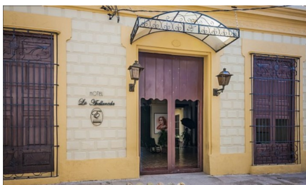
Fig. 10 Hotel La Avellaneda. Fachada Principal

La vivienda, de una amplia planta desarrollada en torno a un patio interior rodeado por galerías de circulación, logró incorporar nueve habitaciones y una suite matrimonial (Fig. 11), la cual se ubicó en el área original perteneciente al antiguo zaguán. Este proyecto, como lo indica su nombre, se ha dedicado por entero a Tula, insigne poetisa nacida en Camagüey a pocos metros de dicho inmueble y cuya obra trasciende el ámbito local y nacional para convertirse en una de las personalidades más importantes de la literatura en idioma español.