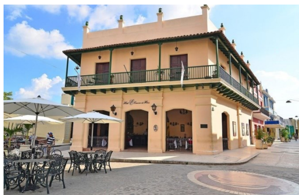
Fig. 4 Fachada Principal Hostel Camino de Hierro

El proyecto construido, consideró el desarrollo de un hostel con nueve habitaciones, siete en planta alta y dos en primer nivel, articuladas mediante un vestíbulo-recepción ubicado en el antiguo zaguán de la vivienda y hacia la plazuela del Gallo; así como un servicio de bar-restaurante, que garantiza animación las 24 horas y genera un mejor diálogo del edificio con su entorno (Fig. 4).