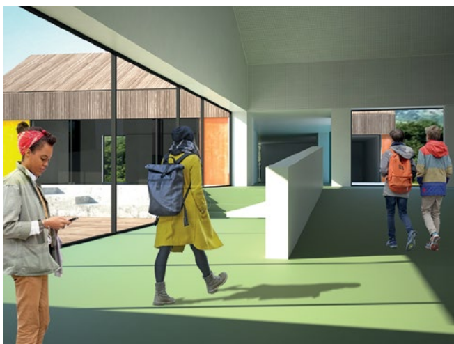
Figura 6. Vista dall'atrio di ingresso verso la corte dedicata alle attività collettive.

Alla base, lungo tutti i fronti, una fascia continua alta 2,25 m, alterna la facciata ventilata in pannelli composti di fibre