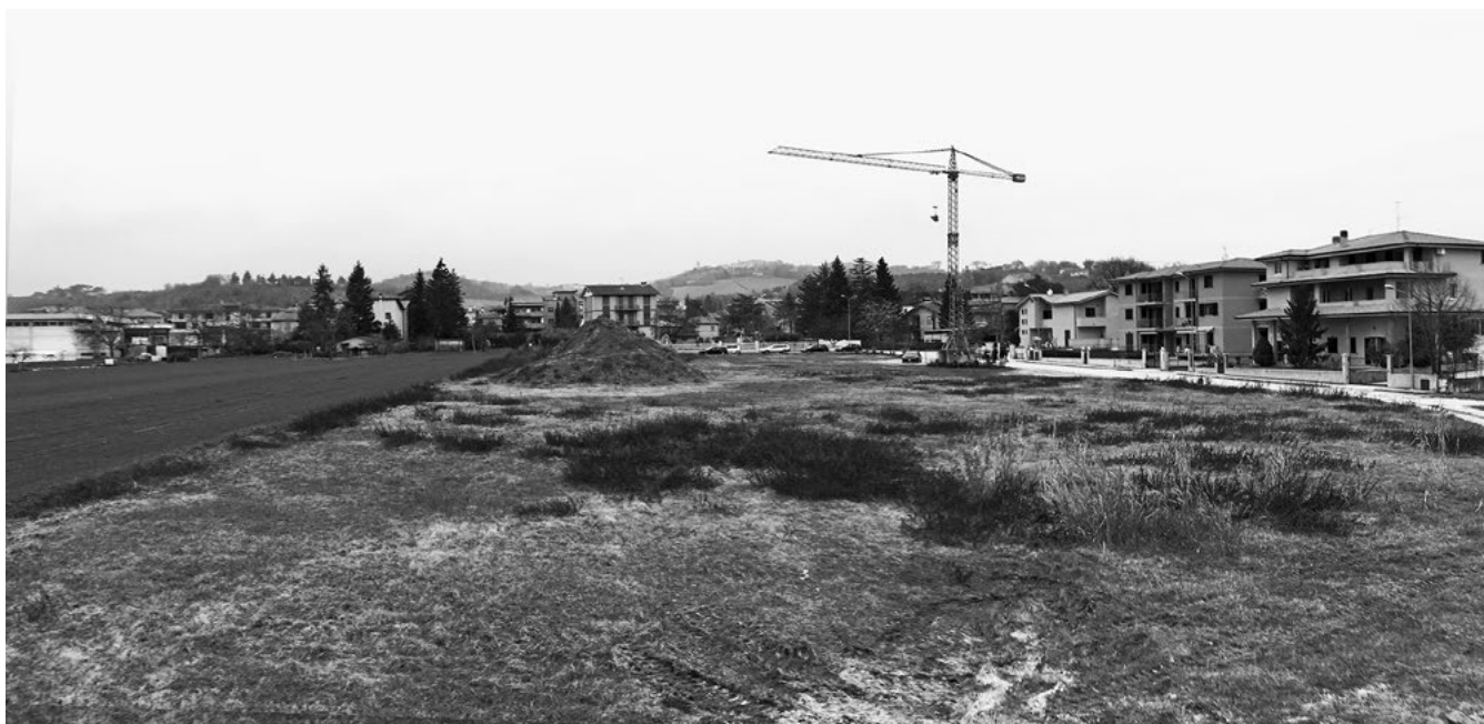
Figura 1. L'area a Piane di Falerone (FM) individuata per la realizzazione della nuova scuola media Don Bosco a Falerone.

L'impianto distributivo per aggregazione di elementi base del progetto mira a tradurre le scelte di organizzazione del programma in una sequenza di spazi sotto il profilo funzionale.