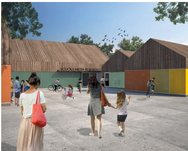
Figura 3. Vista dalla piazza pubblica di accesso al complesso.