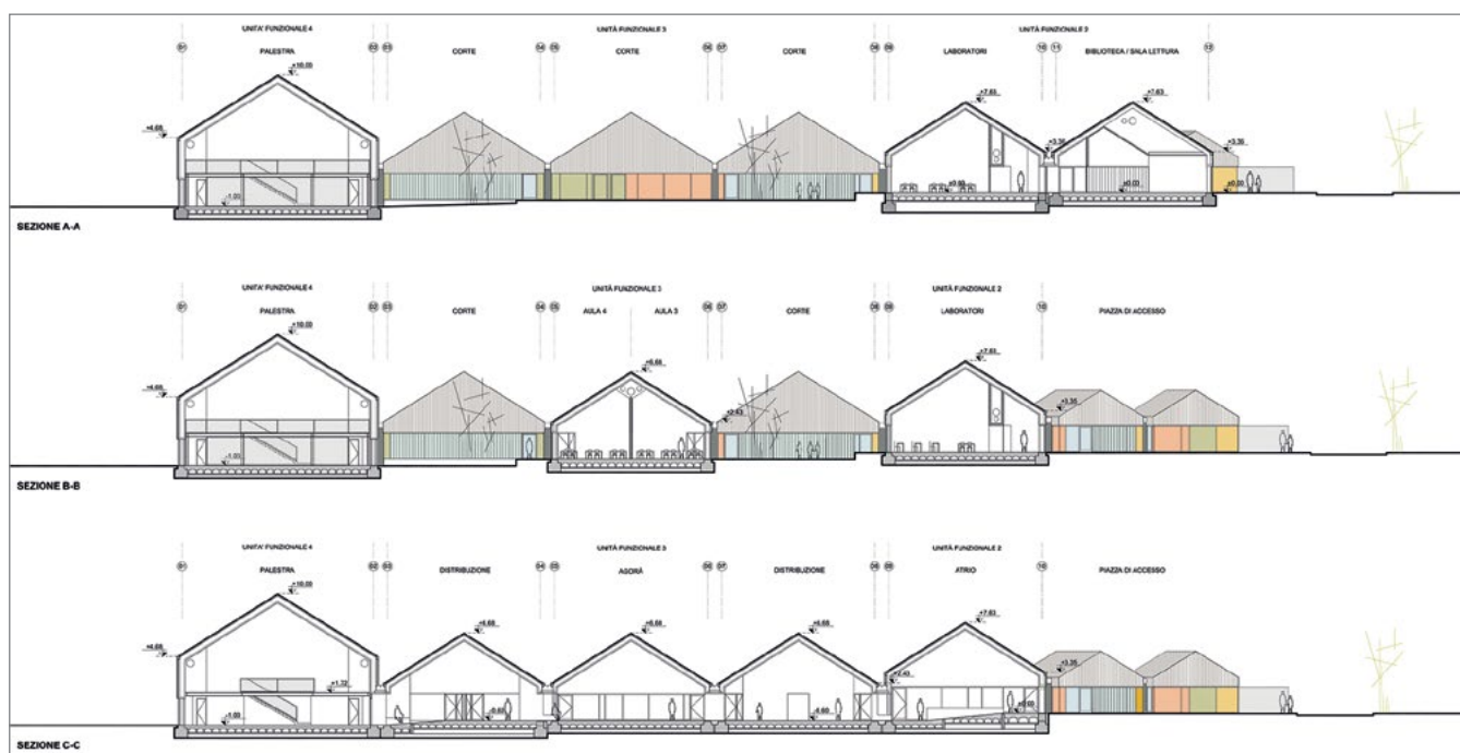
Figura 5. Sezioni longitudinali. Il rapporto tra spazi interni ed esterni e il sistema distributivo della socialità.

tal senso gli spazi serventi – immaginati come ambienti interni da vivere, non solo come semplici corridoi – oltre a garantire l'accessibilità alle unità funzionali, sono concepiti dal progetto come luoghi privilegiati della socializzazione, dell'incontro e dell'inclusione degli utenti.