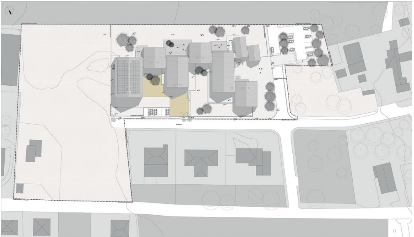
Figura 2. Planimetria generale delle coperture e sistemazioni esterne.

Quattro “Unità funzionali”, tra loro collegate senza soluzione di continuità, ospitano le principali attività, raggruppate per funzioni tematiche: