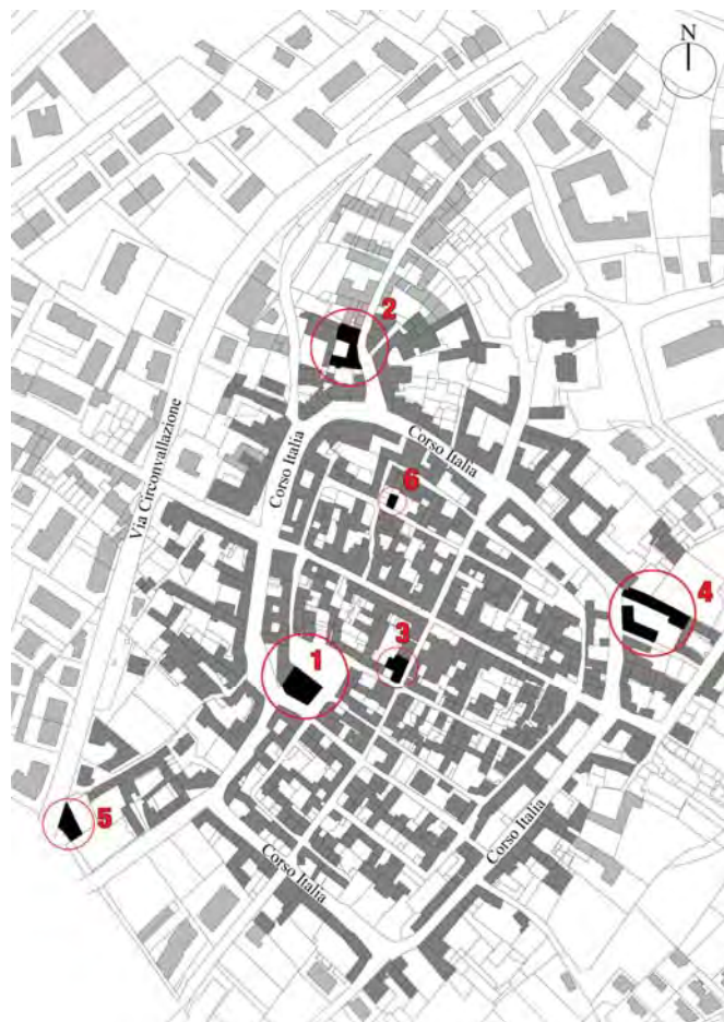
Fig. 1 – Mappa del centro storico di Gassino Torinese con indicati i siti oggetto di indagini progettuali elaborate nel corso dell'edizione 2015 di Sewing a small town