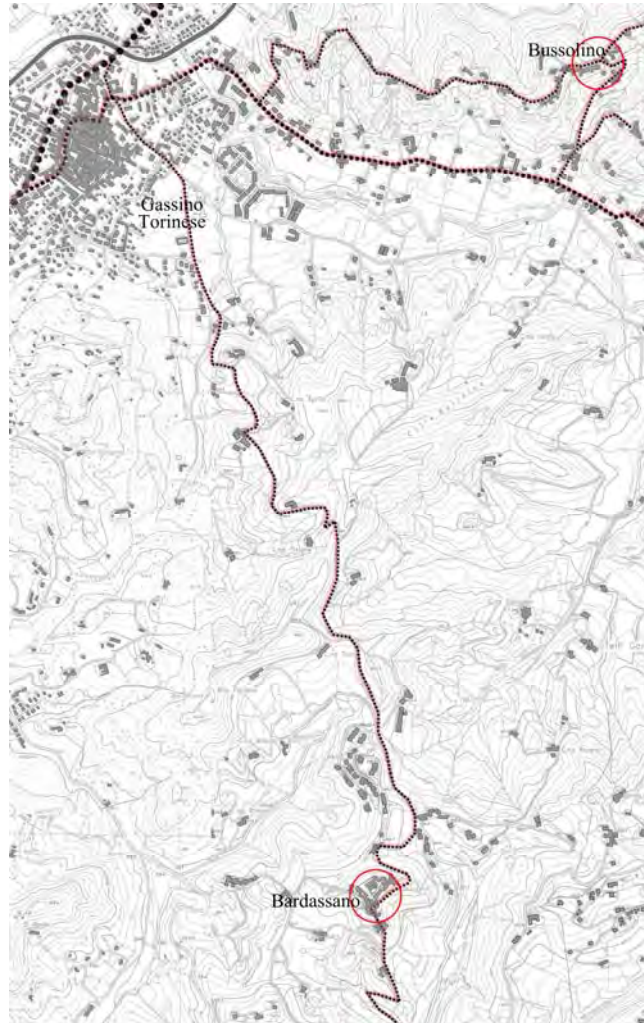
Fig. 5 – Mappa del territorio compreso tra Gassino Torinese, Bussolino e Bardassano con indicati i siti di progetto

Gassino Torinese, l'Archivio di Stato di Torino e l'Istituto Geografico Militare, è stato possibile rintracciare tanto le valenze territoriali quanto i diversi caratteri tipologici ricorrenti relativi alle singole costruzioni. Lo sviluppo di un'analisi storica condotta su differenti ambiti disciplinari ha permesso quindi l'articolazione di innovative strategie di intervento per far fronte allo spopolamento di ciascuna area oggetto di studio.