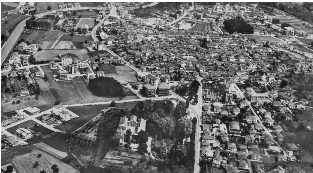
Fig. 4 – Veduta di Gassino Torinese dal Poggio di S. Grato