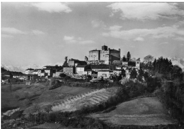
Fig. 6 – Veduta del Castello di Bardassano