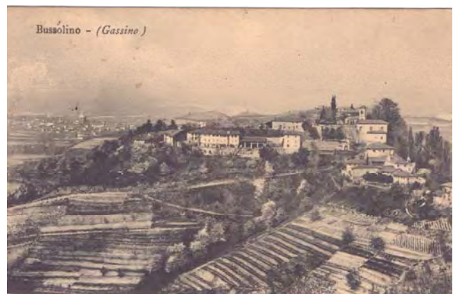
Fig. 7 – Panorama di Bussolino in una cartolina viaggiata il 31 agosto 1913