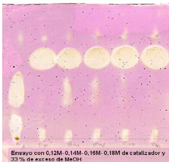
Figura 3: TLC Resultados de la obtención de metil ésteres de aceite de algodón, con diferentes cantidades de catalizador.