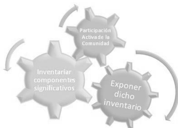
Imagen N° 2: Inventario del patrimonio cultural

Resumidamente, la elaboración del inventario del patrimonio cultural, implica: