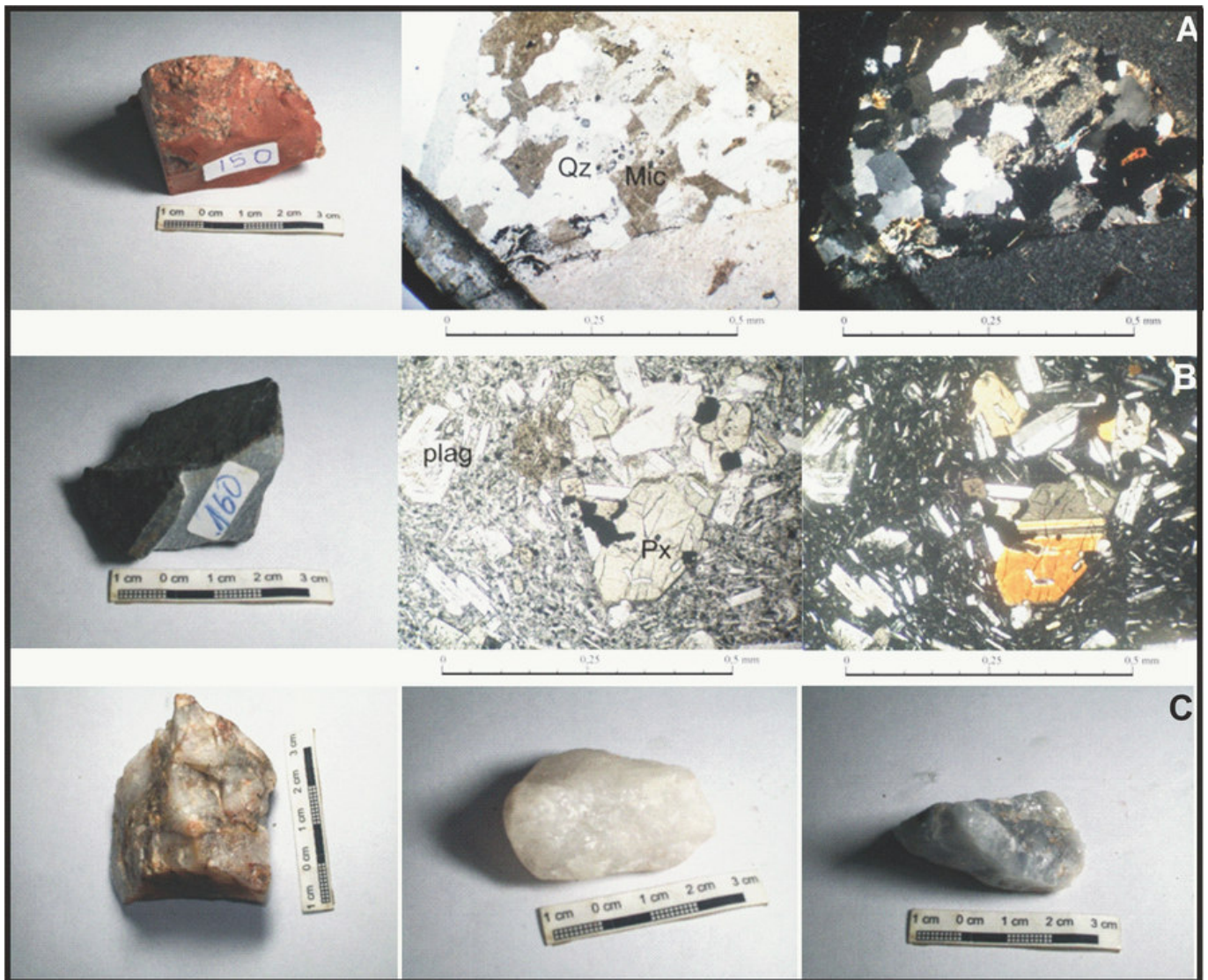
Figura 2: A) brecha sobre roca granítica y detalle de clastos graníticos con nicols paralelos y cruzados (100x); B) basalto y detalle de cristales porfíricos de plagioclasas y piroxenos (100x); C) muestras de diferentes cuarzos.

petrográfico microscópico de cortes delgados. El estudio de las secciones delgadas fue realizado por el Lic. Miguel Blanco en el laboratorio de microscopía óptica del Instituto de Recursos Minerales (IN-REMI-UNLP). Se utilizó un microscopio petro-calco-gráfico Nikon Optiphot Pol y lupa binocular Olympus SZH10 .