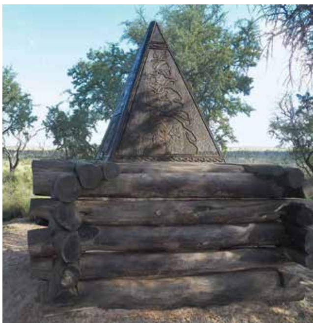
Mausoleo de Mariano Rosas en Leuvucó.