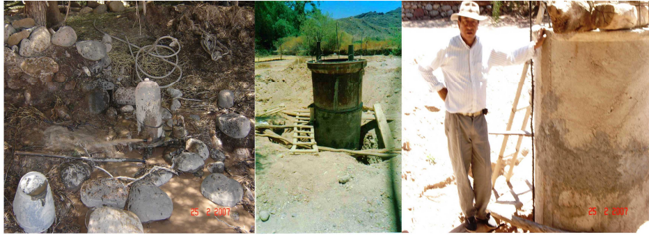
Figura 2: El ariete y la excavación del pozo en dos momentos diferentes.

El nivel freático del agua subterránea se encontró a los 3 metros de profundidad. El agua entra por el fondo del pozo. El cavado del pozo se hizo durante los meses de enero y febrero del presente año, período de lluvias estivales en la región. Se espera un descenso del nivel freático durante la época seca, razón por la cual se consensuó con los actores, la continuación del pozo cuando éste alcance su nivel mínimo. Actualmente se extrae el agua mediante una electrobomba centrífuga y se envía por una cañería de impulsión enterrada hasta la cisterna de reserva.