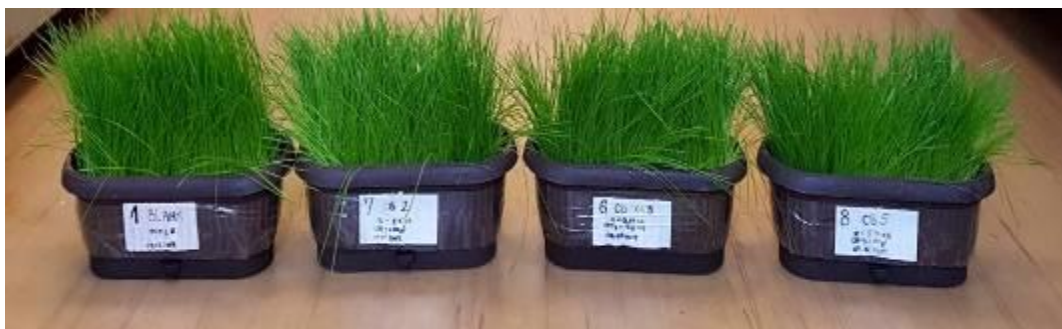
Slika 1. Izgled biljke Lolium perenne gajene u pot-eksperimentima na netretiranom i tretiranom zemljištu (0,3%, 2% i 5% aditiva BC).

teflonskim kivetama mikrotalasnom digestijom (MARS 5, CEM Corporation, USA) uz dodavanje 5 mL HNO 3 i 1 mL H 2 O 2 .