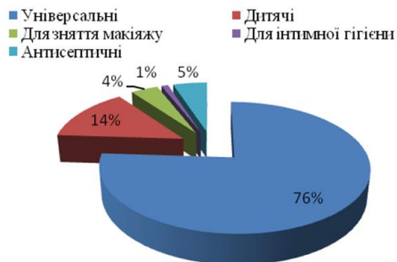
Рисунок 2 – Структура споживання вологих серветок в Україні

Що стосується України, то найбільшу частку продажів – 78 % займає категорія універсальних вологих серветок, дитячі вологі серветки займають частку 14 %, серветки антибактеріальні – 5 %, серветки для зняття макіяжу – 4 %, для інтимної гігієни – 1 % загального обсягу продажів у кількісному вираженні (рис. 2).