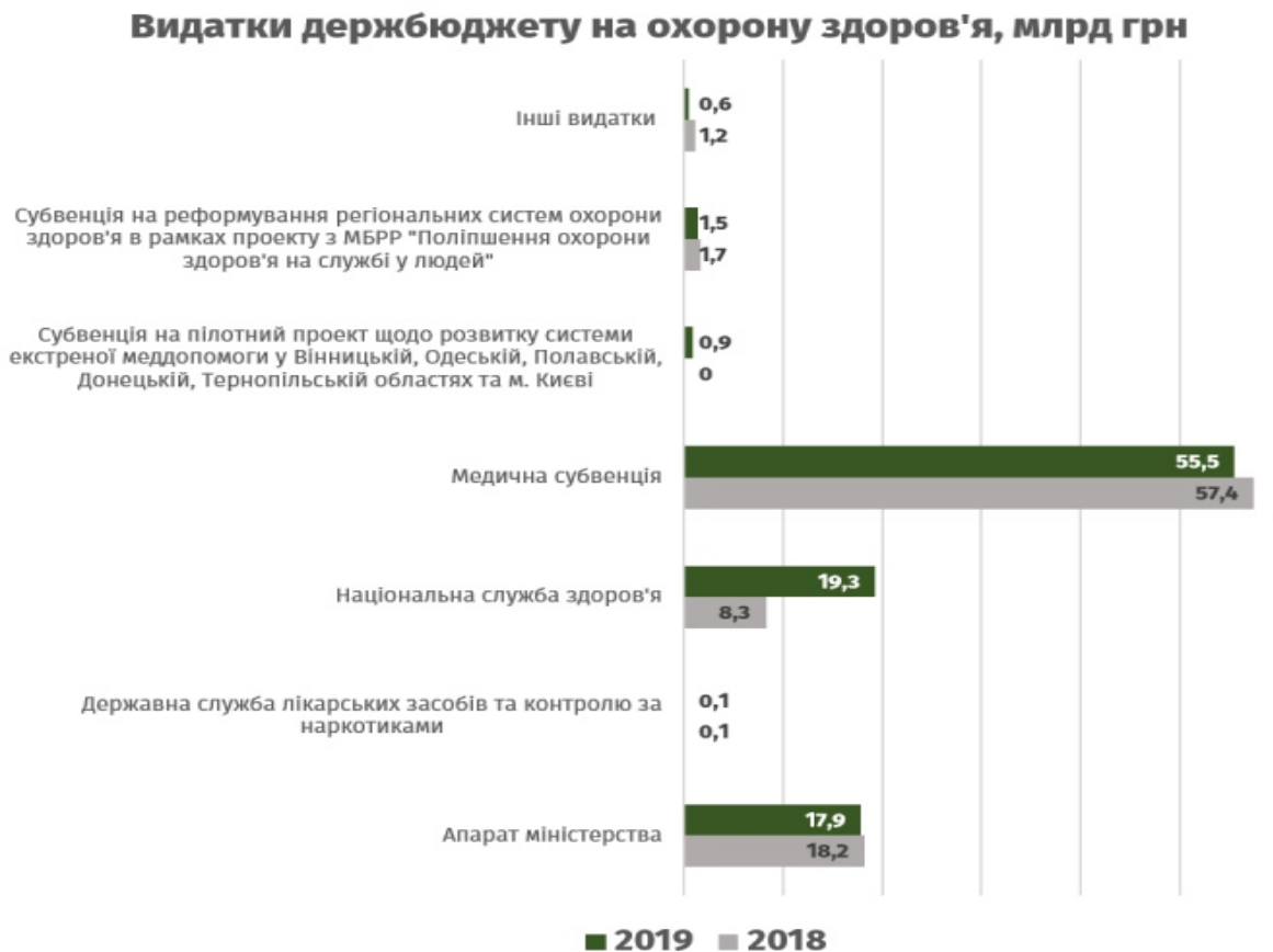
Рис. 1. Видатки держбюджету на охорону здоров'я в Україні, млрд. грн

Зарубіжний досвід країн із розвинутими системами охорони здоров'я доводить той факт, що вітчизняна медична галузь може ефективно та