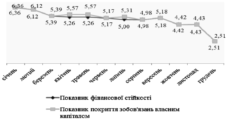
Рис. 1. Динаміка кількості КУА, що мали негативні відхилення від встановлених значень пруденційних нормативів протягом 2014 року, % [9]