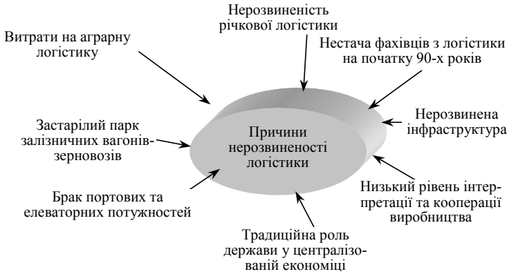
Рис. 1. Причини нерозвиненості логістики в АПК України

Витрати на логістику українських компаній значно більші за витрати аналогічних європейських чи американських компаній. За підрахунками компанії Noble Resources Ukraine, вартість витрат на транспортування і сертифікування до порту, а також вартість перевалки на FOB становить для України 50 дол./т, тоді як для США та країн ЄС 29 і 24,2 дол./т відповідно [2].