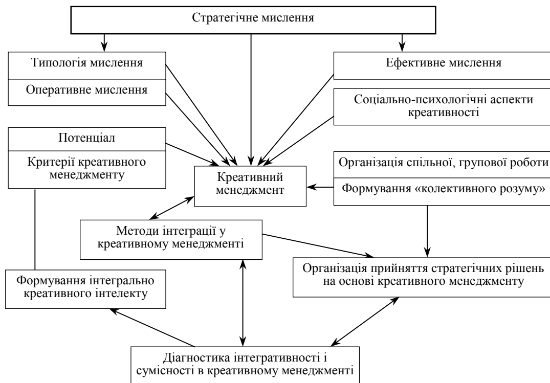
Рис. 1. Концепція креативного менеджменту [6]

Креативний менеджмент представляє собою управління носіями інтелектуального потенціалу підприємства, які створюють нові знання шляхом творчої діяльності. Креативний менеджмент заснований на сучасних технологіях управління творчістю та командної роботи [8, с. 85]. Завдання креативного менеджменту — управління процесом прийняття творчих рішень у колективі шляхом поєднання консервативного логічного мислення із законами сучасного менеджменту та польотом творчої фантазії. Концепцію креативного менеджменту подано на рис. 1.