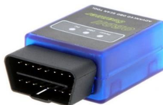
Figura 3. Lector de OBDII utilizado para la adquisición de datos.

Las mediciones de campo implicaron el uso de instrumentación y equipos especializados, los que permitieron determinar el consumo de combustible, el desgaste de los neumáticos, la distancia recorrida por las unidades y el número de pasajeros. Para medir los datos de distancia, trayectos y consumo de combustible se utilizó un lector de diagnóstico a bordo con protocolo (OBDII), que incorpora un GPS. Este dispositivo se colocó en una muestra de tres taxis del cantón, los cuales estuvieron instrumentados durante un periodo de dos meses, obteniendo de esa manera más de 3000 viajes que fueron procesados para el estudio. El equipo utilizado como se muestra en la Figura 3 es un data logger OBDII que se lo calibró para que pueda grabar datos a 1 Hz.