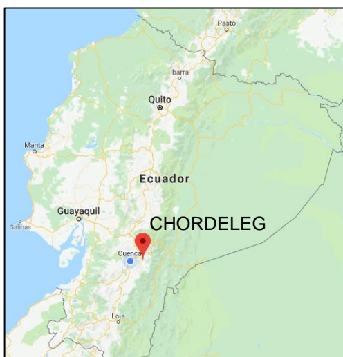
Figura 2. Ubicación geográfica Cantón Chordeleg.

Este trabajo se realizó en el municipio de Chordeleg, ubicado al sur de Ecuador a 463 km de la capital, Quito. La ubicación geográfica del cantón objeto de estudio se puede visualizar en la Figura 2 . Chordeleg tiene una población de aproximadamente 12700 habitantes y una superficie de 104,7 km 2 . (GAD Chordeleg, 2010).