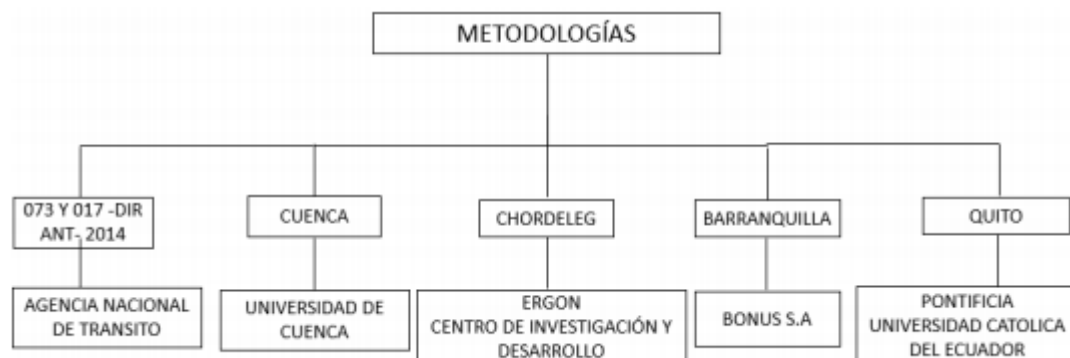
Figura 1. Estudios de tarifas locales

Un proceso de asignación de costos será la herramienta fundamental que permitirá determinar el costo de las variables que conforman la tarifa. La correcta recolección de la