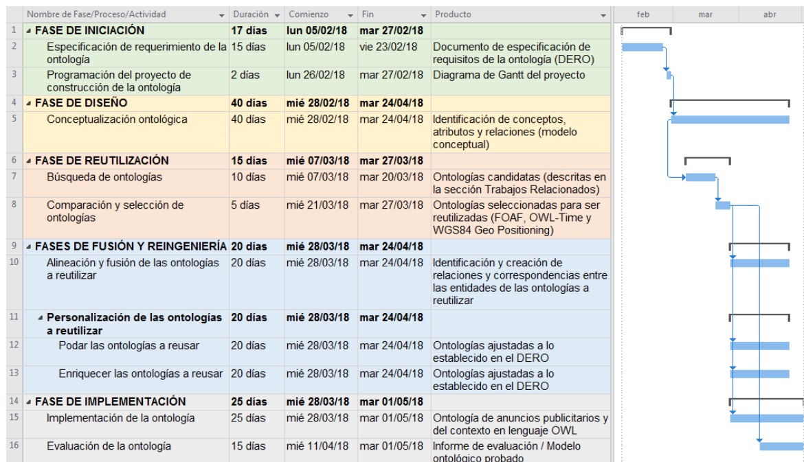
Figura 1. Diagrama de Gantt del proyecto para la construcción de la ontología.