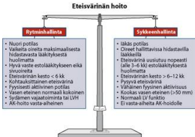
KUVA 2. Eteisvärinän hoitolinjan valinta (Heikkilä ym. 2008)