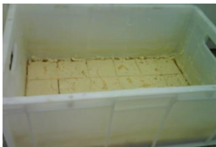
Figura 4. Sabão de álcool produzido com 3 L de água + 700 g de soda.

Para as demais formulações empregando o extrato aquoso de cinza, ou seja, as elaboradas com 500 e 600 g de soda, como para o ensaio anterior (conduzido com água e 700 g de soda), também não se constatou a produção de um sabão de boa qualidade (Figuras 5a e 5b).