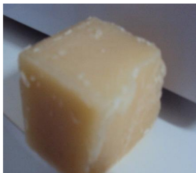
Figura 2. Sabão de álcool produzido a partir de uma receita cheia.

Partindo desta receita testaram-se as demais, as quais foram conduzidas empregando o extrato alcalino das cinzas como substituto parcial da soda.