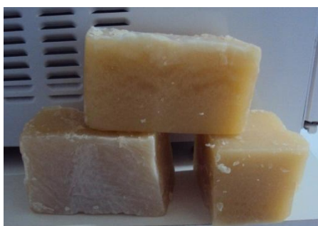
Figura 3. Sabão de álcool produzido com 3 L de extrato de cinza + 700 g de soda.

Foram conduzidas três formulações empregando em substituição aos três litros de água, o extrato aquoso de cinza. Devido a sua alcalinidade, o mesmo pode atuar como agente complementar a soda na reação de saponificação que ocorre na produção do sabão (VENQUIARUTO et al., 2010). A quantidade de soda empregada nestas novas formulações variou entre 700 e 500 g. Destas, a única que conduziu a formação de um sabão com aspecto similar ao conduzido empregando 1 kg de soda (Figura 2) foi à formulação conduzida empregando 700 g de soda (Figura 3).