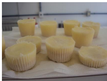
(b) Gordura + extrato + soda