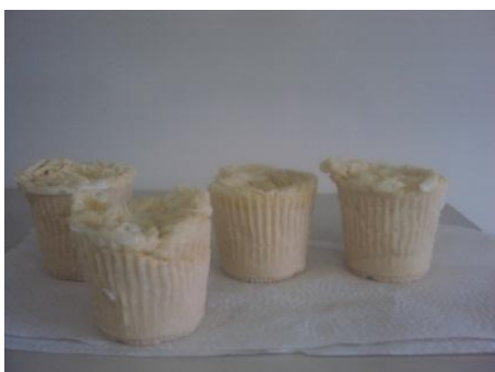
(a) Gordura + água + soda

Para os sabões produzidos em escala reduzida (1:50), independente da receita testada não se obteve sabões com bom aspecto visual, como pode ser visualizado na Figura 1.