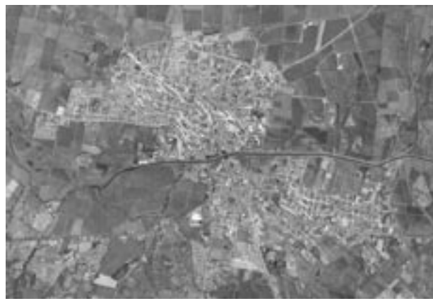
Figura 2 Sistemas de fractura en la zona urbana

El segundo sistema tiene una orientación N-S, la longitud del trazo es menor, de aproximadamente 550 m con una anchura de cerca de los 200 m, el desnivel entre el bloque hundido y el levantado llega a ser de más de 25 cm. La edad del hundimiento, de acuerdo con algunos reportes que se han obtenido, es de 25 años. El tercer sistema presenta una orientación E-O, se manifiesta al poniente, centro y surorientado de la ciudad, es un sistema sísmicamente activo, que se ha manifestado en los eventos de 1995 y 2002. Posee una longitud de 1 000 m y se han registrado daños muy severos a las construcciones, particularmente con el sismo de 1995.