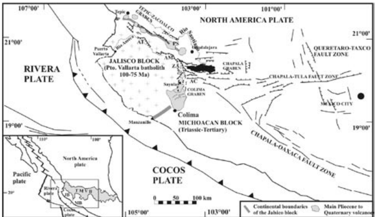
Figura 1 Ambiente geodinámico del occidente de México

El bloque de Jalisco está definido por el graben de Colima, la Trinchera Meso-Americana y el sistema Tepic-Zacoalco. Las zonas de falla Chapala-Oaxaca y Chapala-Tula tienen un sentido sinistral. TMVB, Faja Volcánica Transmexicana. Adaptado de Harrison y Johnson (1988) y Rosas-Elguera et al. (1996).