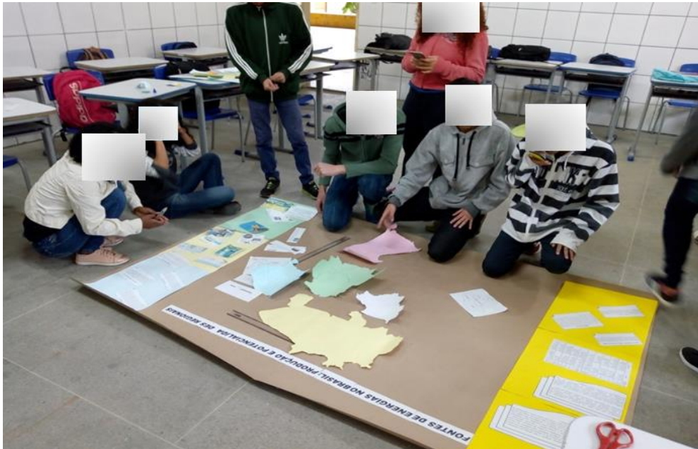
Figura 4: Momento de discussão de opiniões para montagem do mapa e composição do painel. CIENB, 2018.