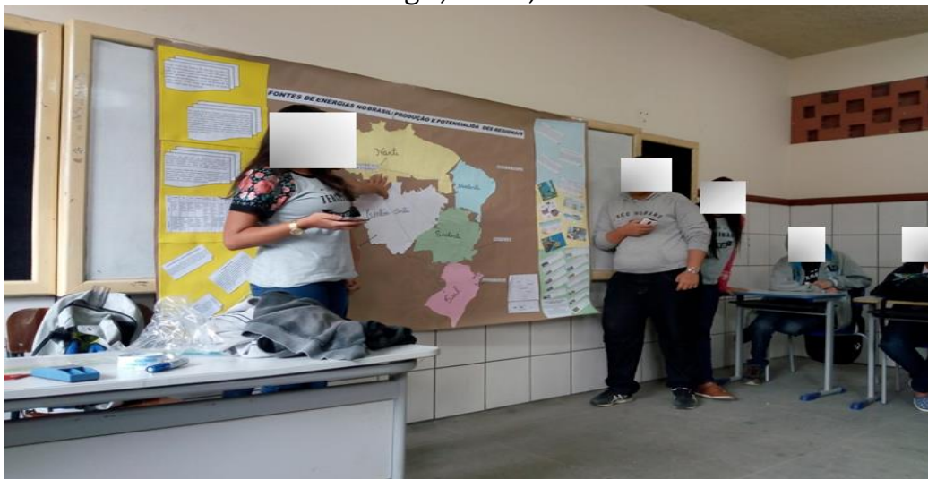
Figura 5: Momento de apresentação oral de cada equipe e respectiva região e fonte de energia, CIENB, 2018.

Entendeu-se que o mais importante na metodologia era os alunos participarem de todo o processo: pesquisa, elaboração, discussão e formação do mapa com as informações espaciais e textuais completas. Entretanto, no final da atividade, foi abordado o conceito de escala e apontado que as proporções de tamanho referentes para cada região não seguiram o padrão adequado para a elaboração de mapas científicos; diante disso, foi solicitado que a turma escolhesse uma escala fictícia para a folha catalográfica. Por conseguinte, no último exercício da atividade (figura 5), depois do painel pronto com o mapa do Brasil e todas as informações, os grupos fizeram apresentações orais sobre suas pesquisas, com o painel fixado na lousa e apresentaram sua respectiva região e fonte de energia para os demais colegas da sala.