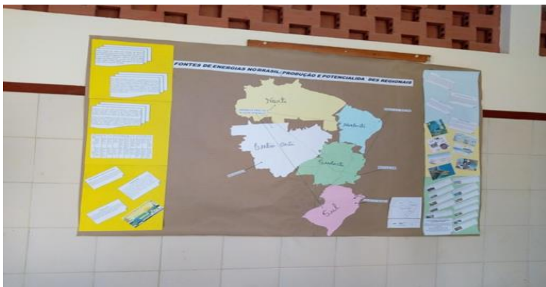
Figura 6: Mapa pronto e afixado na parede do pátio para acesso a toda escola. CIENB, 2018.

Ainda foi possível verificar a satisfação dos alunos com o resultado final do trabalho e também em disponibilizar o painel para toda a escola, eles ficaram felizes em ver o resultado do painel e em saber que aquele material foi produzido por eles de forma coletiva. Que não foi um trabalho feito por um grupo, e sim consequência de um trabalho em equipe, resultado de pesquisas realizadas, de ideias que eles tiveram juntos, de discussões coletivas (figura 6).