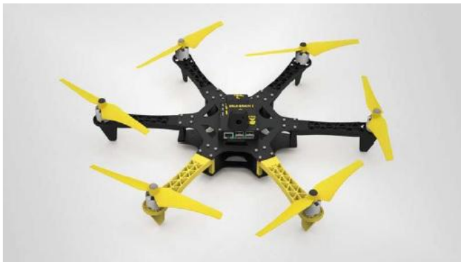
Slika 2 - Raspberry Pi dron

Interpretacija. Od studenta treba zahtevati da demonstrira sposobnost razumevanja realne pojave, njenog modeliranja primenom usvojenog teorijskog znanja, prikupljanja podataka i njihove pravilne interpretacije i identifikacije trendova u datom skupu, sa ciljem da se što bolje razvije logika razumevanja sveta u kojem živimo. Manuelno rešavanje matematičkog modela, statističku analizu i proces predviđanja trendova će preuzeti računari.