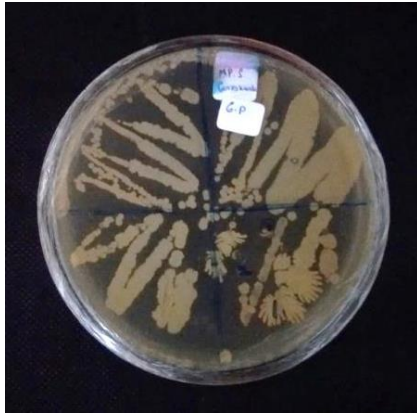
Gambar 2. Hasil isolasi bakteri simbiosis spons yang tumbuh dalam media NA.

Berdasarkan hasil pengamatan morfologi, didapatkan 5 isolat bakteri simbiosis spons yang menyerupai Cribochalina sp.