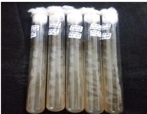
Gambar 3. Pertumbuhan Koloni Bakteri pada Agar Miring

Widiyaningsih, dkk. (2018) melaporkan menisolasi 10 isolat bakteri simbion dari karang lunak Sinularia sp, dimana hanya satu isolat bakteri saja yang teridentifikasi memiliki kekerabatan dengan Pseudomonas stutzeri . Isolat bebas yang telah dikarakterisasi ditumbuhkan ke dalam media miring untuk dijadikan stok bakteri terlihat pada Gambar 3.