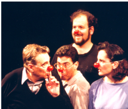
Figure 1: Jacques Lecoq avec ses élèves..

Le petit nez rouge du clown , cette boule de couleur qui illumine les yeux et arrondit le visage, agit comme un masque, « le plus petit masque du monde » selon l'expression de Lecoq. Car, comme un masque, le nez rouge opère une mutation. Quand on le met, ce n'est