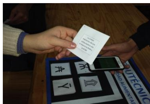
Figura 3. Parte frontal de una de las cartas

Tanto los contenidos teóricos y los visuales los construye el docente, en este caso el mismo elaboró una serie de cartas y fichas las cuales en su dorso contenían marcas de realidad aumentada que se asociaban al software y, mediante una aplicación los alumnos podían observar el video educativo referido a esa marca. Luego de la observación pasaban a un proceso de evaluación, este consistía en que los alumnos debían leer los textos de cada carta y considerar si era verdadera o falsa su afirmación (Figura 3), de considerarse verdadera lo apartaba y colocaba con el dorso hacia arriba para luego el docente y alumno verificara, mediante la aplicación, si es correcta o incorrecta su elección. En el primer caso arrojará un cartel aumentado de color verde sino siendo incorrecto.