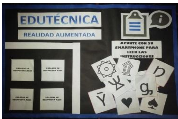
Figura 2. Prototipo Inicial del OA

Finalizando este proceso se obtiene una primera versión del objeto de aprendizaje (Figura 2).