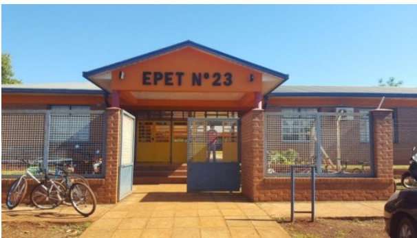
Figura 1 - Institución Educativa

Para implementar el marco de trabajo propuesto se eligió una escuela de nivel secundario en la modalidad técnico en instalaciones electromecánicas de la provincia de Misiones, específicamente en la ciudad de Concepción de la Sierra ubicada en la zona sur de la provincia (Figura 1).