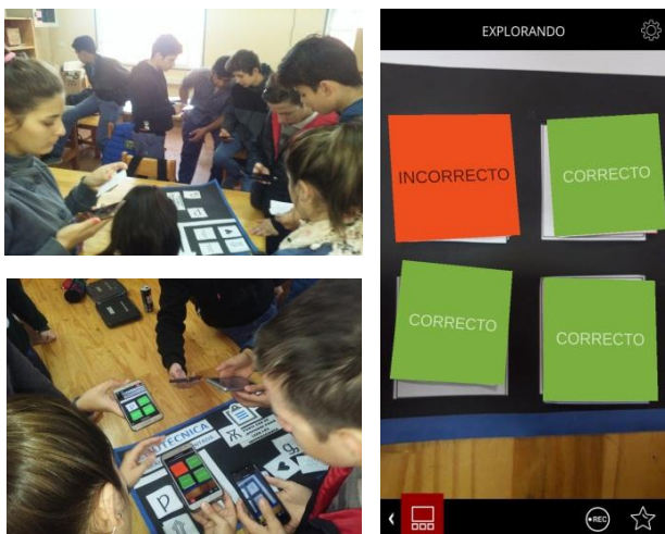
Figura 4. Alumnos utilizando el OA

La prueba de la aplicación y del objeto de aprendizaje en total duró 180 minutos dividido en dos momentos de 90 minutos. El total de usuarios que utilizaron el framework es de 42 alumnos y 1 docente, hubo 3 ausentes (Figura 4).