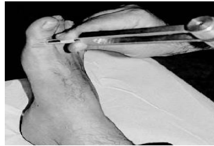
Gambar 2. Tuning fork (garpu tala) pada pemeriksaan diabetik neuropati.

garputala ini adalah untuk mengetahui sensibilitas kaki melalui vibrasi. Deteksi dengan garputala dapat dimulai di plantar hallux . Garputala standar dengan ukuran 128 Hz bisa digunakan sebagai pemeriksaan tunggal, yang hasilnya setara dengan pemeriksaan garputala yang dikombinasikan dengan Semmes Weinstein Monofilament (SWM) dalam mendeteksi neuropati diabetik.