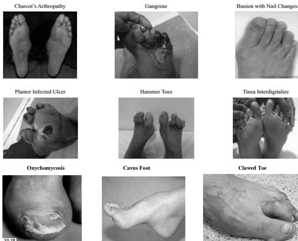
Gambar 4. Kelainan anatomik kaki pada DFU.

Pada tahap pemeriksaan ini juga dilakukan pemeriksaan permukaan kaki untuk mengetahui apakah ada deformitas. Ciri deformitas lokal, dapat dilihat dengan seksama oleh pemeriksa berupa: adanya kontraktur dan keterbatasan gerak sendi. Hal ini dapat kita lihat dengan menyuruh pasien berjalan. Kedua keadaan tersebut menimbulkan menyebabkan mobilitas sendi terbatas dan kelainan anatomik kaki yang dapat dilihat pada gambar 4.