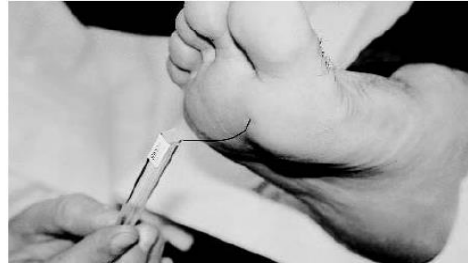
Gambar 3. Semmes weinstein monofilament (SWM)