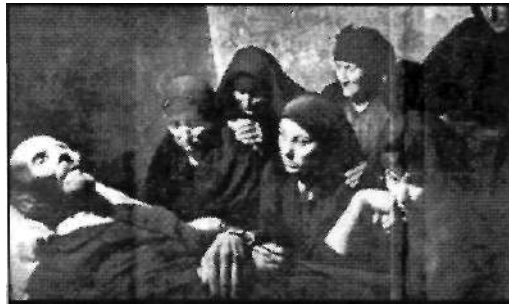
Foto 4 Velatorio español

La fotografía 4 es un texto fotográfico realista que describe el velatorio de un difunto (" Velatorio español ").