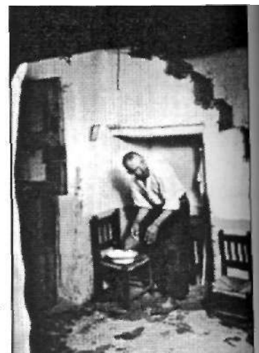
Foto 2 Campesinos en casa

La fotografía 2 nos muestra una escena de aseo. El interior encalado, desprovisto de puertas y de suelo desigual crea un espacio mediocre e indiferenciado: un rincón bajo el hueco que dejan los escalones que dan paso de un nivel a otro de la vivienda (vivienda-desván). El mobiliario doméstico se reduce un par de sillas de anea, un espejo minúsculo sobre la pared y un jofaina para el agua, ante la que un campesino ha sido sorprendido por la cámara en el acto de lavarse.