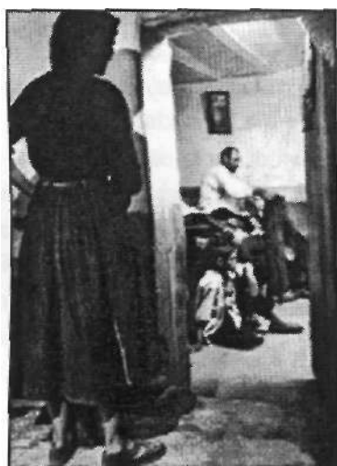
Foto 3 Campesinos en casa

La fotografía 3 muestra dos espacios diferenciados: en el del fondo, un campesino, sentado en una cama, se pone (o quita) los pantalones y, junto a él, hay un niño sentado en el suelo; en primer plano una campesina de espaldas, a contraluz, parece observar la escena que se desarrolla en segundo término a través del vano de una puerta que separa los personajes masculinos de la mujer. El enfoque exagera la figura de la mujer, desdibujándola y hace nítido el segundo plano.