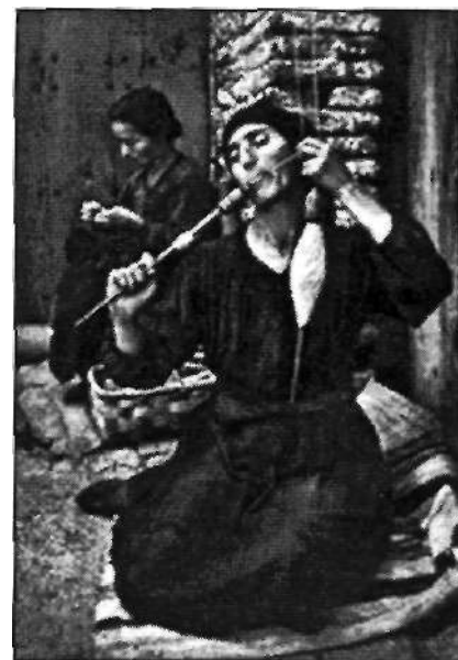
Foto 5 La hiladora

En la fotografía 5 ( La hiladora ) el autor nos muestra, sobre un fondo de paredes de piedras y puertas rústicas, dos figuras femeninas dedicadas a tareas artesanas. La que aparece en el primer plano, con las piernas recogidas hacia atrás, está sentada sobre una manta de telar y se dedica a devanar la hebra de hilo con el huso; al fondo, sentada sobre una silla baja, la segunda mujer se dedica a coser. En la descripción de este texto fotográfico hay que incluir igualmente otros elementos como la cesta de madera de castaño 17 (entre ambas mujeres), la textura del fondo (suelo y paredes de piedra) y la manta.