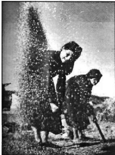
Foto 6 Aventando el grano

El autor nos muestra en la imagen dos mujeres, miembros singulares de una sociedad, que nos aportan información sobre las posibilidades de desarrollo que ofrece esa sociedad a sus ciudadanos (en este caso ciudadanas), situación constatable en la realidad del momento en que se realizaron las fotografías (1950), fecha en que España estaba saliendo todavía de la autarquía, en que la industrialización sólo había calado en zonas muy concretas de la geografía española y los comportamientos tradicionales seguían vigentes.