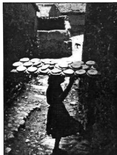
Foto 8 Llegada del pan

También las fotografías 7 y 8 nos muestran otros ámbitos de trabajo rurales y vías de ingreso para la familia, campesina. La primera (" Pesado de manzanas "), hace alusión al comercio de producción sobrante que aflora inevitablemente en comunidades aldeanas de economía agrícola (frutas, hortalizas); la segunda (" La llegada del pan "), a la elaboración y abastecimiento del pan, uno de los elementos básicos de la dieta campesina.