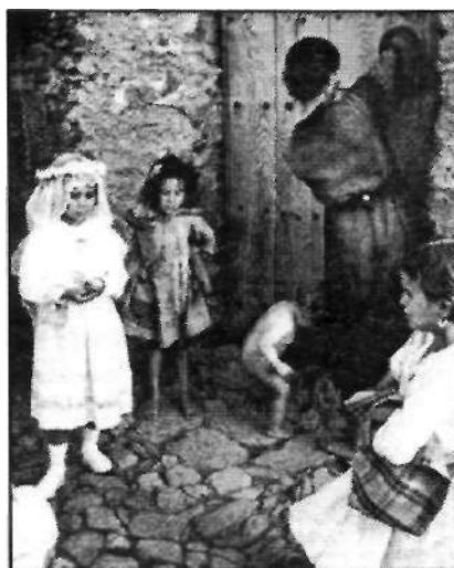
Foto 9 La Primera Comunión

Todas ellas recogen rasgos de una economía de Antiguo Régimen y de una producción artesana y rural que dependía principalmente de las mujeres campesinas quienes alternaban los trabajos domésticos y agrícolas con la producción de telas y la confección de vestidos para el autoconsumo.