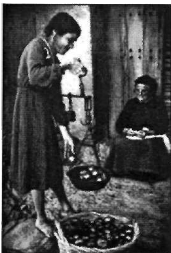
Foto 7 Pesado de manzanas

Otros elementos de interés son la duplicación de las imágenes que transmite la impresión de un trabajo rítmico y acompasado; la postura de las mujeres (la espalda doblada), así como la expresión contraída de los rostros que nos hablan de personajes que viven condenados a duros trabajos.