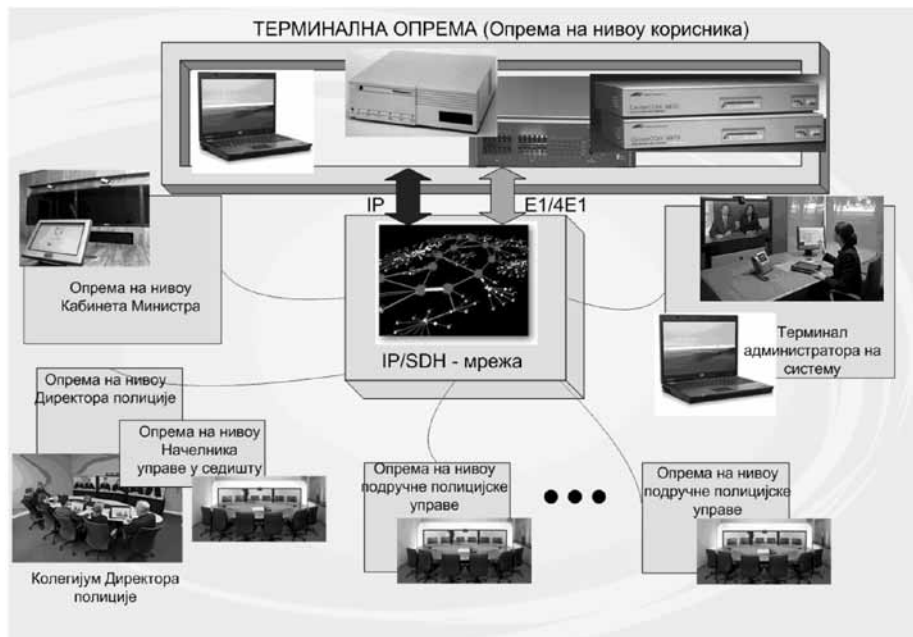
Слика 4 – Конфигурација мреже видео конференцијске везе