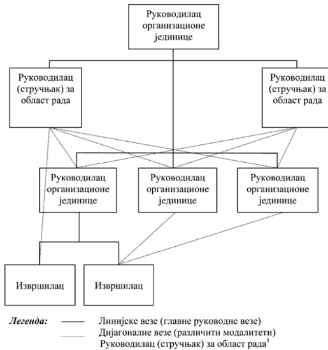
Слика 1 – Линијске и дијагоналне везе у МУП РС (Субошић, 2010:51.)

Синтезом вертикално и хоризонтално диференцираних организационих јединица МУП-а РС могуће је, поред истоимених веза, међу њима идентификовати и дијагоналне везе. Оне настају на релацијама организационих јединица или појединаца у њима који су на различитом нивоу хијерархије, у различитим хоризонтално диференцираним јединицама. На пример, ако међусобно сарађују функционални руководиоци на различитим хијерархијским нивоима организације или функционални руководилац на вишем и главни (општи) руководилац на nižем нивоу, односно, функционални руководилац и извршилац, везе које се међу њима остварују у геометријском смислу су дијагоналне. С друге стране, ако командир вода из једне чете непосредно службено комуницира са командиром друге чете, можемо говорити о претходно наведеном модалитету дијагоналног повезивања у структурно диференцираним, истоврсним организационим јединицама које се међусобно разликују по хијерархијском нивоу (слика 1).