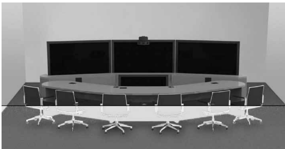
Слика 2 – Начин дизајнирања техничког система успостављања видео конференцијске везе за потребе МУП-а РС

технологије свој развој све више прилагођавају потребама тржишта, а комерцијални задаци представљају својеврстан изазов који може једноставно да се реши комбиновањем различитих, већ актуелних технологија. Пре анализе једног од могућих и понуђених решења као одговор на питање како што једноставније и ефикасније организовати службени састанак у циљу доношења одређене одлуке, неопходно је нагласити да МУП РС, у оквиру кога као основна организациона јединица функционише Сектор за аналитику, телекомуникационе и информационе технологије, већ поседује изузетно развијену информациону мрежу. Управо тај систем може да одговори на поменуто питање техничких могућности за превазилажење проблема у организовању састанака у циљу хитног одлучивања, с тим што су његови капацитети далеко већи.