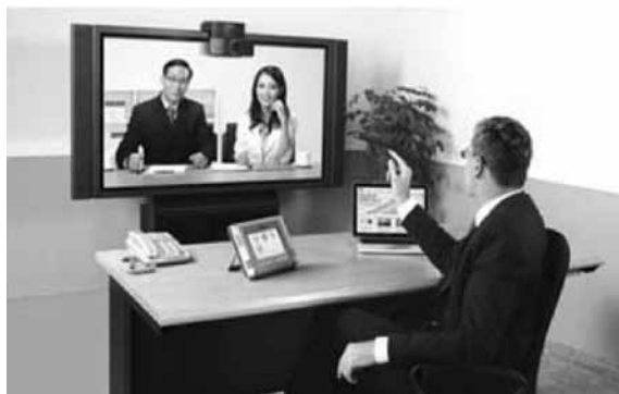
Слика 6 – Изглед сале за састанке са три учесника 1:2, уни-екран