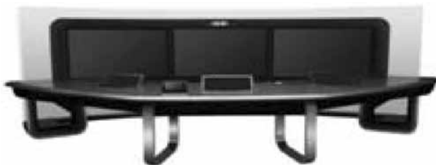
Слика 5 – Систем видео конференцијске везе – изглед сале за састанке са три учесника са обе стране