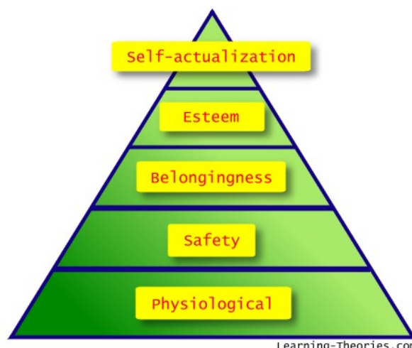
Slika 1 - Maslovljeva hijerarhija ljudskih potreba, (izvor: www.learning-theories.com/wp-content/uploads/2007/03/maslows-hierarchy-of-needs.jpg )

U cilju zadovoljenja jedne od najvažnijih ljudskih potreba i ispunjenja jednog od preduslova održivog razvoja, borba protiv kriminala zauzima značajno mesto. Cilj ovog rada je da ukaže na značajan uticaj prevencije kriminala kroz oblikovanje prostornog okruženja ka ostvarenju ciljeva održivog razvoja, kroz fizički, društveni i ekološki aspekt u odnosu na savremene pristupe prevencije kriminala.