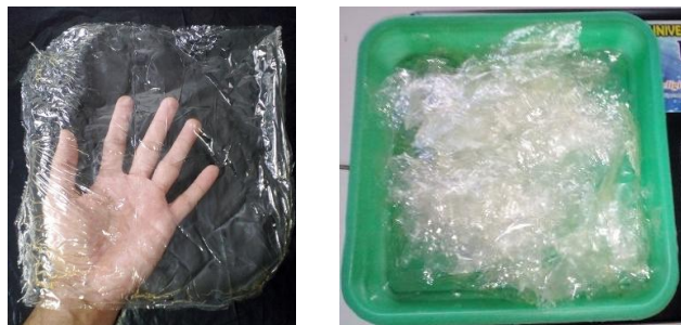
Gambar 4. Lembaran gelatin kulit domba hasil hidrolisis dengan larutan asam kuat