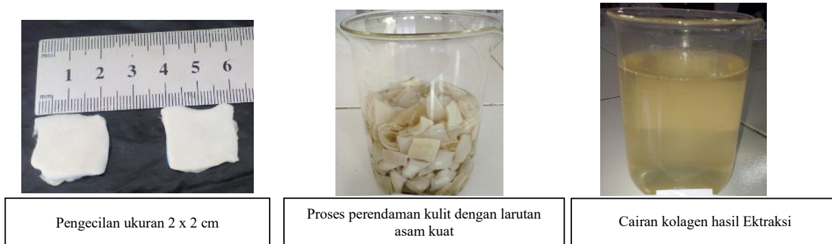
Gambar 3. Proses perendaman larutan asam dan hasil ekstrak kolagen kulit domba