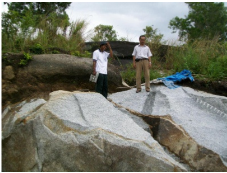
Gambar 6a. Singkapan Granit Segar.

Secara umum granit dalam kondisi sangat lapuk dengan ketebalan soil hasil pelapukan mencapai 10 meter, di beberapa tempat tersingkap granit dalam kondisi segar. Granit, segar berwarna abu-abu berbintik hitam, lapuk berwarna abu abu kecoklatan hingga coklat kemerahan, holokristalin panidiomorfik granular, fanerik sedang- sangat kasar, komposisi mineral tersusun oleh kuarsa, ortoklas, plagioklas, biotit, hornblenda, zirkon dan mineral opak.