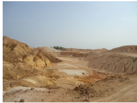
Gambar 10b. Singkapan Granit Menumbing Dalam Kondisi Sangat Lapuk di Desa Menjelang.