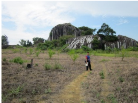
Gambar 8.a. Singkapan Granit segar di daerah Cubu Laut.