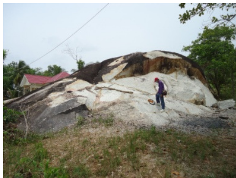
Gambar 9a. Singkapan Granit Segar di daerah sekitar desa Pelangas.

Kenampakan fisik di lapangan granit umumnya telah mengalami pelapukan tingkat lanjut di beberapa tempat tersingkap granit dalam kondisi segar. Granit, segar berwarna abu-abu berbintik hitam, lapuk berwarna abu abu kekuningan, tekstur holokristalin panidiomorfik granular, fanerik sedang - kasar , ukuran mineral 1 mm – 25 mm, komposisi mineral terdiri dari kuarsa, ortoklas, plagioklas, biotit, muskovit.