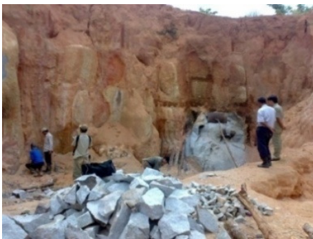
Gambar 4a. Singkapan Granit Segar di daerah sekitar Desa Gadung.

Secara umum singkapan granit dalam kondisi sangat lapuk dengan ketebalan soil hasil pelapukan mencapai 20 meter, di beberapa tempat terdapat singkapan segar. Granit, segar berwarna abu-abu kehitaman, lapuk coklat kemerahan, tekstur holokristalin panidiomorfik granular, fanerik halus - sedang, komposisi mineral kuarsa, ortoklas, plagioklas, hornblenda, biotit, monasit, ilmenit, zirkon.