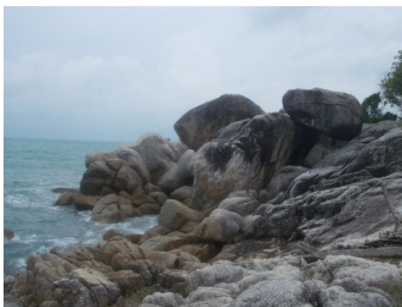
Gambar 7a. Singkapan Granit Segar di pantai Parai.

Kenampakan fisik di lapangan granit umumnya telah mengalami pelapukan tingkat lanjut dengan ketebalan tanah hasil pelapukan mencapai 20 meter seperti yang terdapat di tambang timah Pemali, di beberapa tempat tersingkap granit dalam kondisi segar seperti di pantai Parai, pantai Tanjung Pesona, bukit Betung, pantai Penyusup dan pantai Penyamun. Granit, segar berwarna abu-abu berbintik hitam, lapuk abu abu kecoklatan hingga coklat kemerahan, holokristalin, fanerik sedang- pegmatitik, komposisi mineral tersusun oleh kuarsa, ortoklas, plagioklas, biotit, ilmenit, zirkon dan hornblenda.