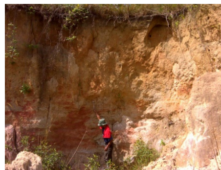
Gambar 5b. Singkapan Granit Lapuk.