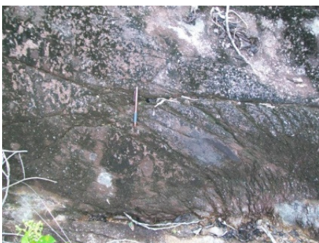
Gambar 5a. Singkapan Granit Segar.

Secara umum singkapan granit ditemukan dalam kondisi sangat lapuk dengan ketebalan tanah (soil) hasil pelapukan mencapai 15 meter, di beberapa tempat tersingkap granit dalam kondisi segar. Granit, segar berwarna abu-abu berbintik hitam, lapuk coklat kemerahan, holokristalin idiomorfik granular, fanerik sedang - kasar, komposisi mineral tersusun oleh kuarsa, ortoklas, plagioklas, biotit, hornblenda dan mineral opak.