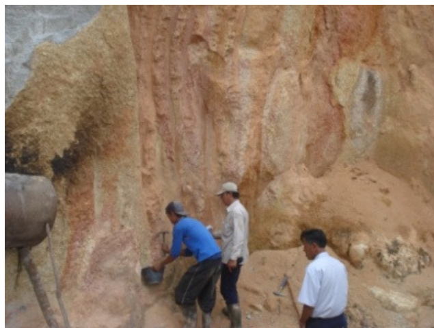
Gambar 2. Metode Pengambilan Sampel Mineral Berat secara Channel Sampling .