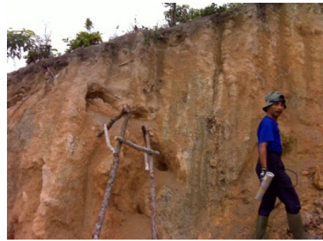
Gambar 6b. Singkapan Granit lapuk.