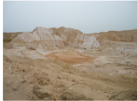
Gambar 8b. Granit Jebus sangat lapuk di daerah Parit tiga.