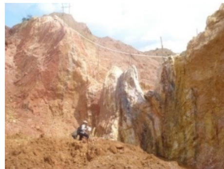
Gambar 4b. Singkapan Granit Lapuk di daerah sekitar Desa Gadung.