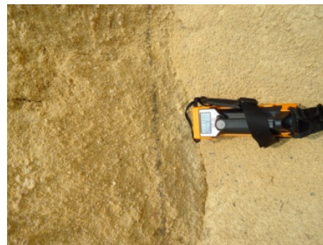
Gambar 9b. Singkapan Granit Lapuk di daerah sekitar desa Pelangas.