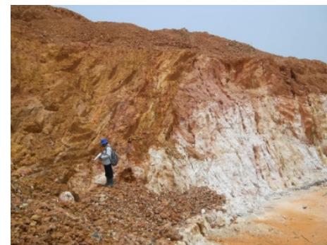
Gambar 7b. Granit Pemali sangat lapuk di daerah Pemali.