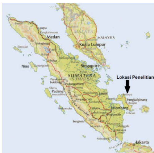
Gambar 1. Lokasi Daerah Penelitian.

Lokasi penelitian terletak di pulau Bangka, secara administratif termasuk dalam kabupaten Bangka Selatan, Bangka Tengah, kotamadya Pangkal Pinang, Kabupaten Bangka dan Kabupaten Bangka Barat (Gambar 1).