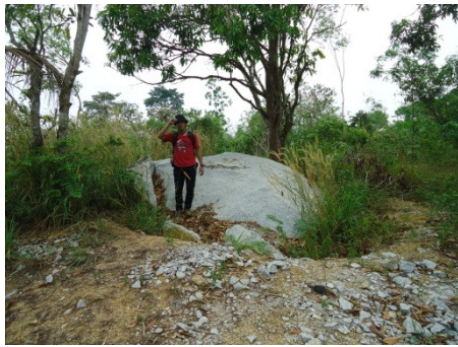
Gambar 10a. Singkapan Granit Menumbing Dalam Kondisi Segar di sekitar bukit Menumbing.